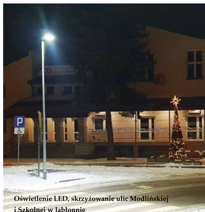
Oświetlenie LED, skrzyżowanie ulic Modlińskiej i Szkolnej w Jabłonnie