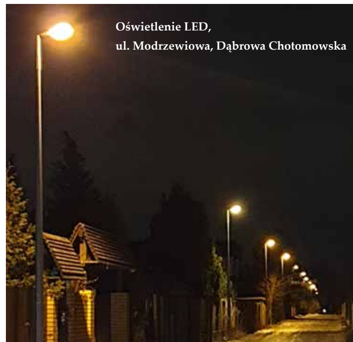
Oświetlenie LED, ul. Modrzewiowa, Dąbrowa Chotomowska