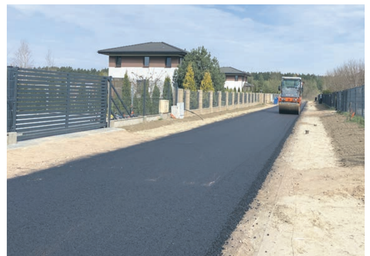
Prace na ul. Kowalika w Skierdach

blisko 1000 m i będą polegały na wykonaniu jezdni o szerokości 3,5 m, wykonaniu poboczy oraz odwodnienia.