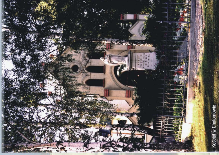
Kościół w Chotomowie