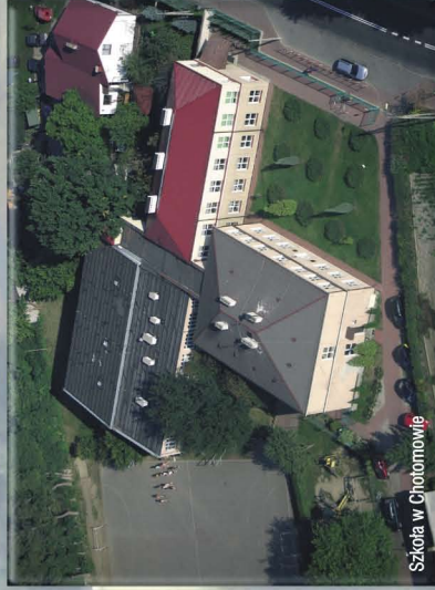
Szkoła w Chotomowie