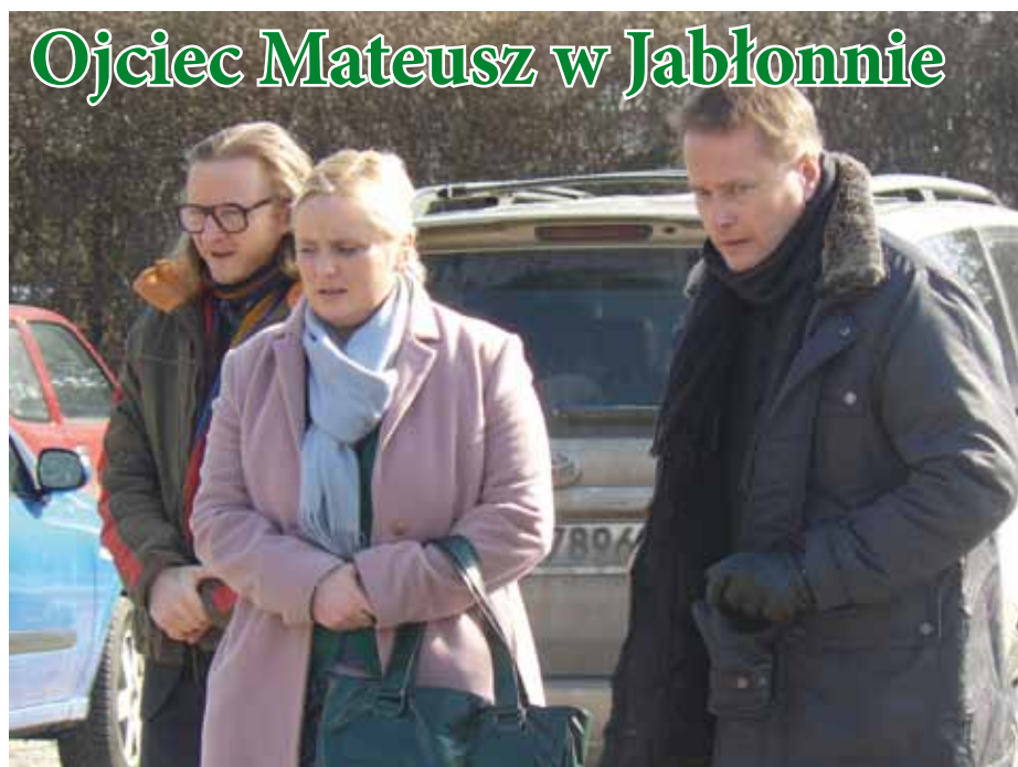
Zdjęcia do serialu kręcono w pałacu i GCKiS w Jabłonnie

Po zakończeniu scen plenerowych, ekipa przeniosła się do wnętrza GCKiS gdzie kręcono kolejne sceny. Tego samego dnia filmowcy gościli również w jabłonnskim pałacu. AO