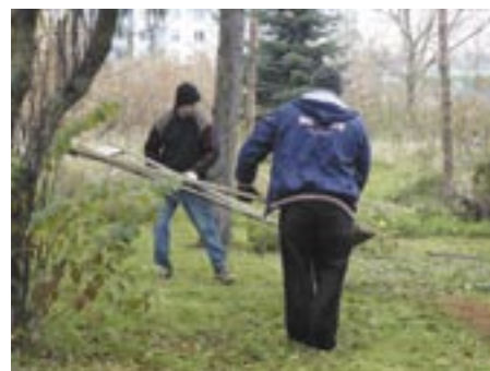
Prace porządkowe terenu rozpoczęły się pod koniec października