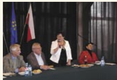
Inauguracja w Chotomowie