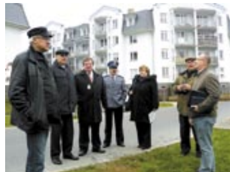
Oględziny terenu, gdzie stanie komisariat