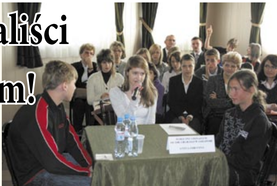
Część ustna - odpowiedź na pytanie

7 października w Gminnym Centrum Kultury w Dąbrowce odbył się IX Turniej Wiedzy Turystyczno – Ekologicznej Związku Gmin Zalewu Zegrzyńskiego. Startowali w nim uczniowie jabłonowskiego gimnazjum. Zdobyli pierwsze miejsce.