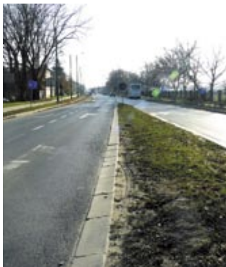
Modlińska przed remontem.