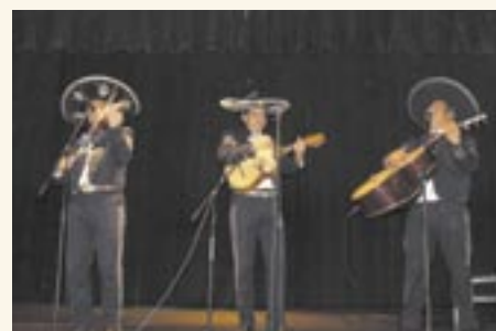
Występ meksykańskich muzyków