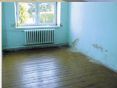
Remont przeprowadzono w wakacje

Po tym krótkim wstępie ks. Leszek Kołoniecki poświęcił sale, po czym goście obejrżeli nowe pomieszczenia i przygotowany specjalnie na tę okazję program artystyczny. Świetlica, zaplecze gastronomiczne oraz łazienka, powstały z zagospodarowania pomieszczeń mieszkalnych. Ich remont odbył się w minione wakacje.