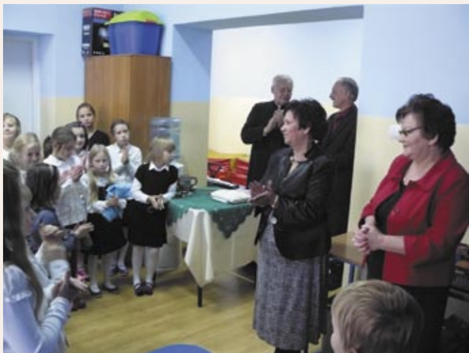
Oficjalne otwarcie odbyło się 13 października