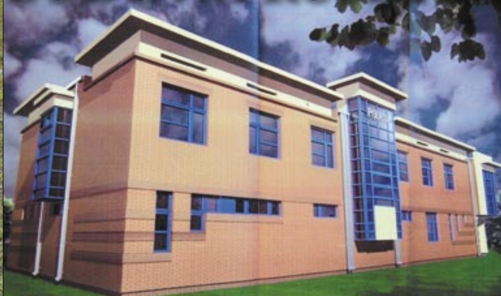
Tak będzie wyglądał jabłonowski komisariat. Powstanie za pocztą w Jabłonie.