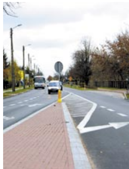
Modlińska po remoncie.