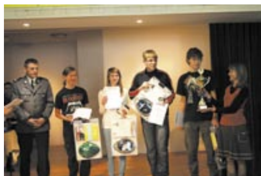
Zwycięzca drużyna z Jabłony

udzielania pierwszej pomocy czy segregacji odpadów. Konkurencje wymagały więc nie tylko wiedzy merytorycznej, ale i praktycznej. Jak pokazały końcowe wyniki,