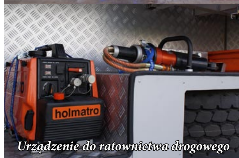
Urządzenie do ratownictwa drogowego