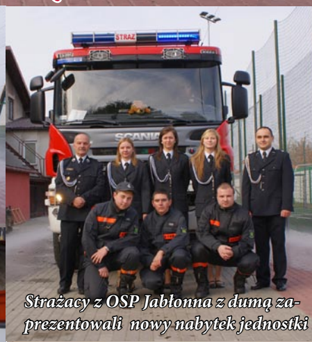
Strażacy z OSP Jabłonna z dumą zaprezentowali nowy nabytek jednostki