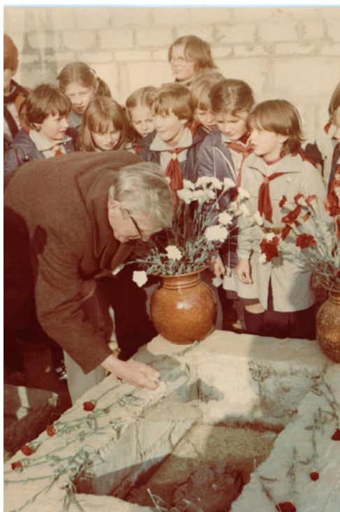
Wmurowanie kamienia pod budowę Domu Ogrodnika