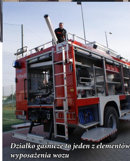
Działko gaśnicze to jeden z elementów wyposażenia wozu