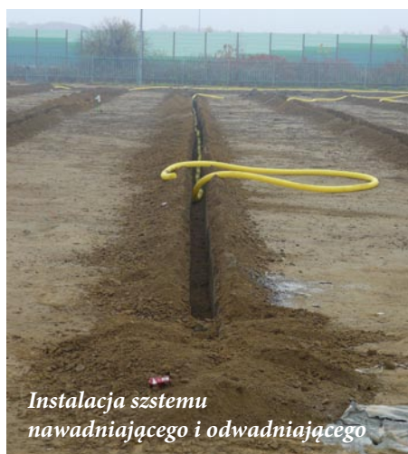
Instalacja szstemu nawadniającego i odwadniającego