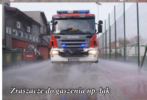
Zrzaszacz do gaszenia np. łąk