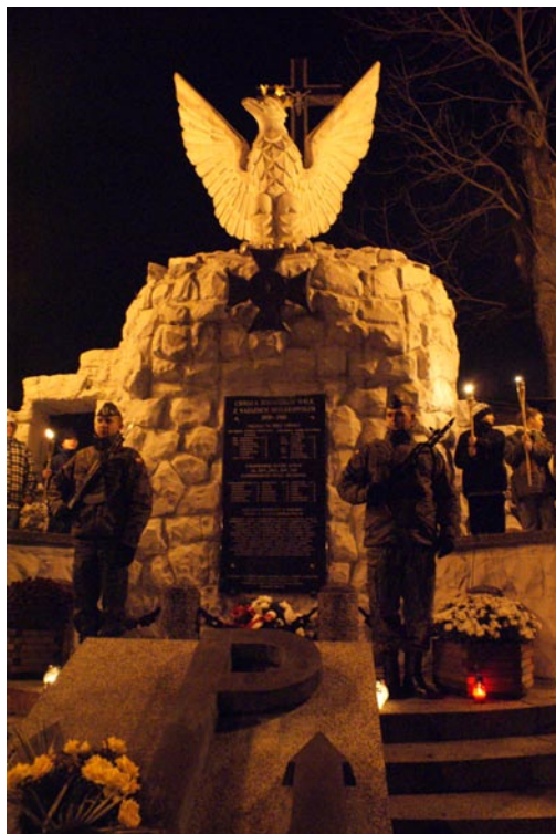
Pomnik Chwały Bohaterów Walk z hitlerowskim najeźdźcą

1 listopada 2011 r. o godzinie 19.00 w kościele parafial- nym w Jabłonie po Mszy św. w intencji Ojczyzny odbył się koncert „Pod Twoją Obronę”. Dzień Niepodległości koncertowo uczczono także w Chotomowie.