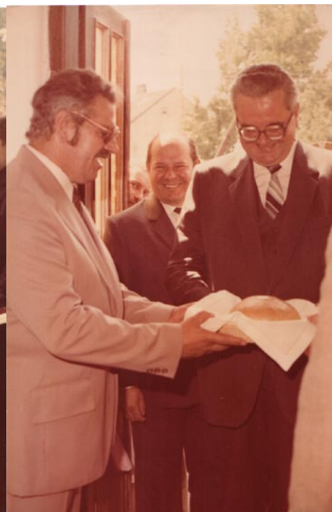
Wicepremier Roman Malinowski na otwarciu ośrodka

ny i całej gminy, a także mieszkańcom Pragi Północ i południowej dzielnicy Legionowa.