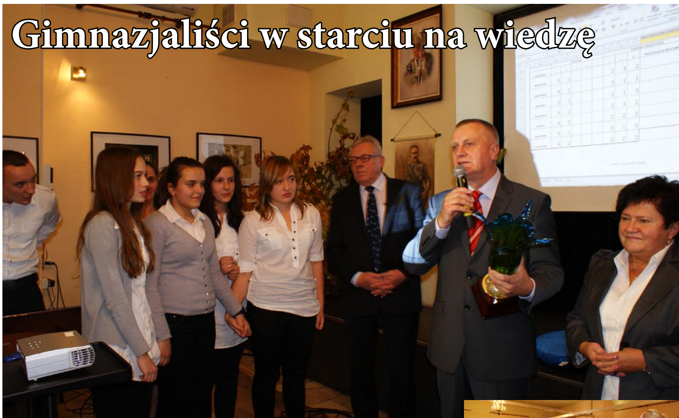
Ogłoszenie wyników konkursu. Zwycięska drużyna z Gminy Nieporęt.

We wtorek 25 października gimnazjaliści z gmin należących do Związku Gmin Zalewu Zegrzyńskiego rywalizowali w finale X Turnieju Wiedzy Turystyczno – Ekologicznej o obszarze ZGZZ.