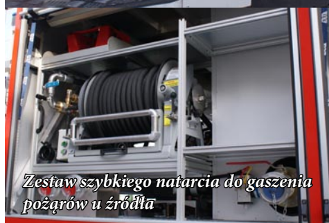
Zestaw szybkiego natarcia do gaszenia pożarów u źródła