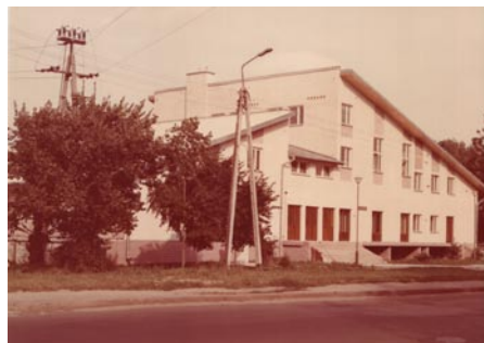
Dom Ogrodnika tuż po otwarciu

Powstający w Jabłonie obiekt był jedną z niewielu budowli w Polsce o tak wszechstronnym przeznaczeniu. Został zlokalizowany na terenach intensywnej produkcji ogrodniczej i powstawał dzięki inicjatywie i funduszom środowiska ogrodniczego, stąd zatem jego nazwa „Dom Ogrodnika”. W zamyśle twórców miał służyć przede wszystkim mieszkańcom Jabłonna