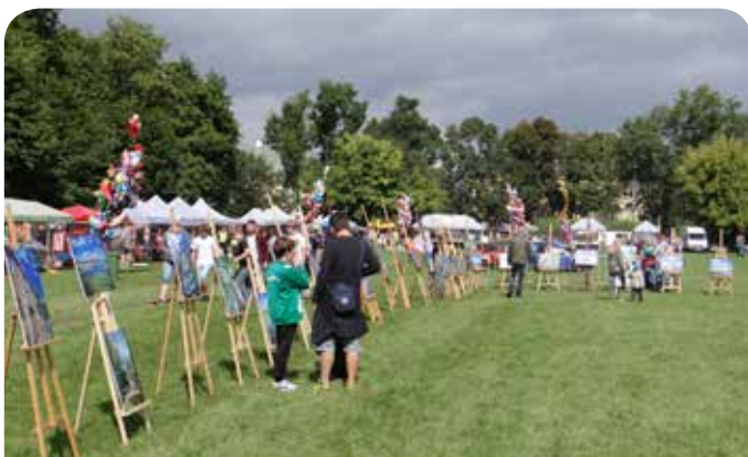
Wystawa zdjęć z obszaru Lokalnej Grupy Rybackiej