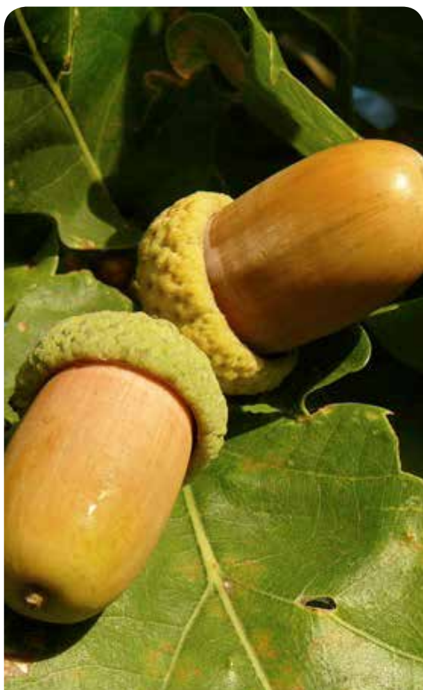
Uczniowie zbierali żołądździe

Konkurs był wspaniałą formą zabawy na świeżym powietrzu, integracji uczniów oraz uczył zasad zdrowej rywalizacji. Jego celem było promowanie wśród dzieci postawy ekologicznej oraz troski o przyrodę.