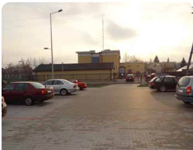
Gmina wybudowała parking za nowym komisariatem