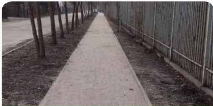
Chodnik z kostki betonowej na ul. Parkowej w Jabłonie

Budowa ul. Promiennej w Chotomowie w ramach zadania wybudowano jezdnię o nawierzchni z szarej kostki betonowej (powierzchnia – 2 066,3 m 2 ) wraz z chodnikiem (również z kostki) o powierzchni 538,0 m 2 i wjazdami na posesje (powierzchnia – 308,0 m 2 ). Wykonano także dwa progi zwalniające, odwodnienie jezdni podłużnym sączkiem chłonnym oraz oznakowanie pionowe i poziome.