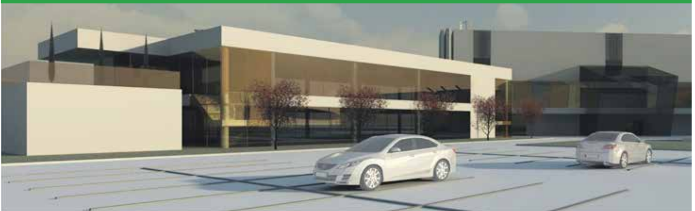
Tak będzie wyglądało Centrum Badawcze PAN

Zgodnie z harmonogramem inwestycja powinna powstać w ciągu najbliższego roku.