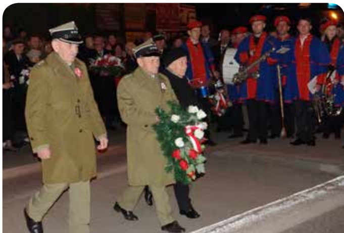
Kombatanci składają kwiaty pod pomnikiem w Chotomowie

11 listopada mieszkańcy Jabłonn i Chotomowa uczcili Święto Niepodległości. W ten wyjątkowy dzień miały miejsce msze święte w intencji Ojczyzny, uroczystości przy pomniku oraz koncert pieśni patriotycznych.