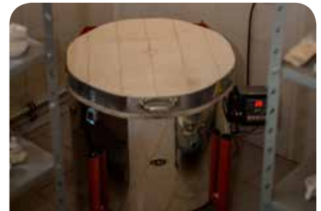
Nowy piec do wypalania ceramiki

Specjalistyczny piec do wypalania ceramiki zakupiono przy dofinansowaniu ze środków Unii Europejskiej – Program Rozwój Obszarów Wiejskich, wysokość dofinansowania to 85%.