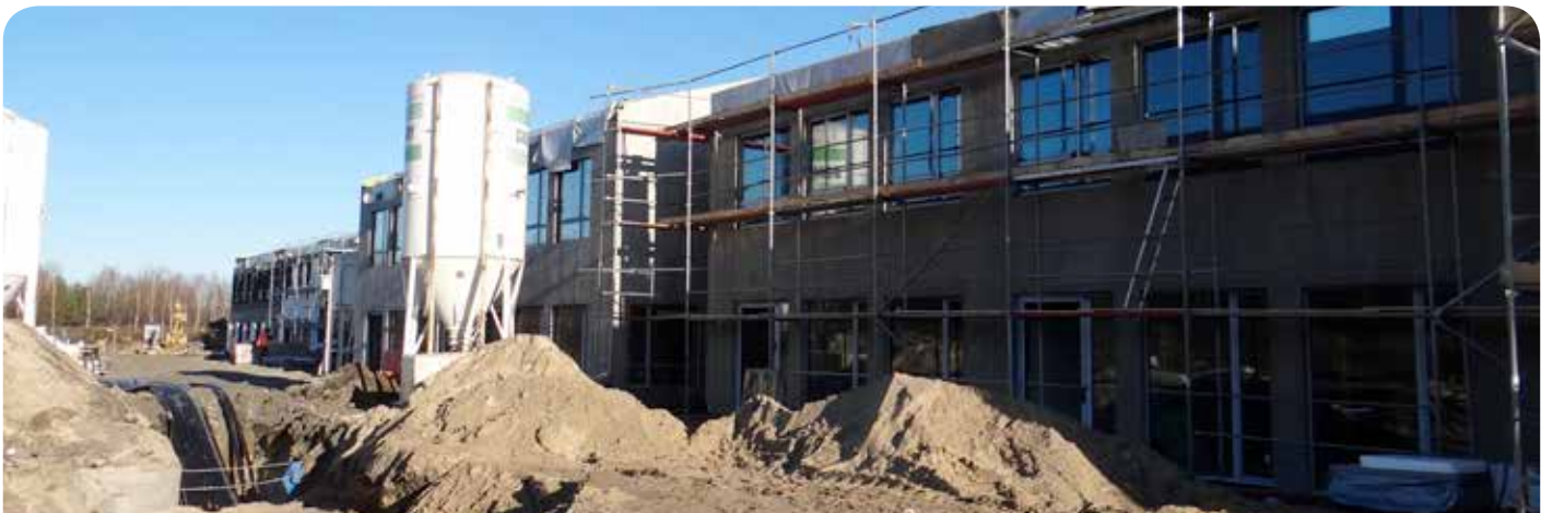
Jednocześnie z pracami w budynku trwają roboty ziemne

Pod koniec października została dostarczona ostatnia partia okien do szkoły, przez cały listopad trwał ich montaż, ponieważ przez okres zimowy będą prowadzone prace wewnątrz budynku.