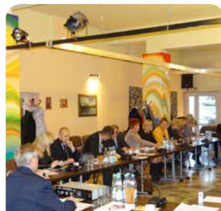
Listopadowa Sesja Rady Gminy

Podczas XXXVII sesji Rady Gminy Jabłonna głosowano nad 18 projektami uchwał. 27 listopada 2013 radni pracowali między innymi nad: stawkami podatków na 2014 rok, uchwaleniem miejscowego planu zagospodarowania przestrzennego gminy Jabłonna dotyczącego: północnej części wsi Chotomów, części południowej wsi Boża Wola oraz wsi Wólka Górská.