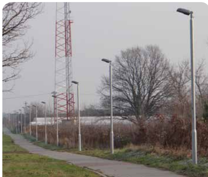
Oświetlenie chodnika wzdłuż DW 630