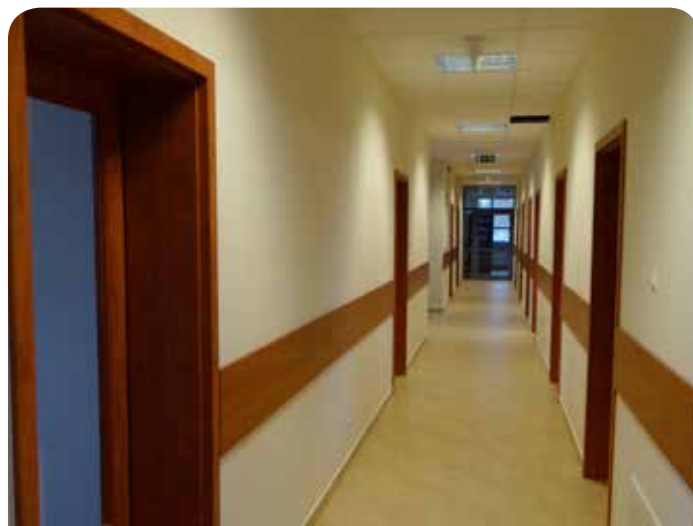
Jeden z korytarzy nowego budynku Policji w Jabłonce