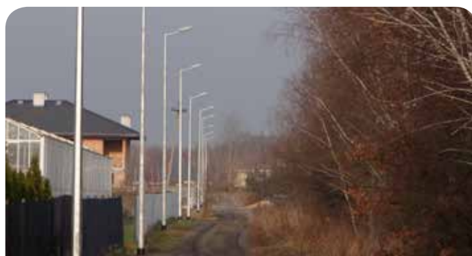
Nowe lampy na ul. Muzycznej w Skierdach

Budowa oświetlenia chodnika przy drodze nr 630 - w ramach inwestycji została sporządzona aktualizacja kosztorysu inwestorskiego. Wybudowano oświetlenie chodnika na odcinku od lampy L198 w Skierdach do lampy L215 w Rajszewie oraz na odcinku od lampy L35 do lampy L54 w Bożej Woli. Łącznie nad chodnikiem wzdłuż drogi wojewódzkiej 630 zaświeciło 38 lamp typu NANO1 ze szklanym kloszem i źródłem o mocy 50W, montowanych na słupach o wysokości 4 m. Inwestycja oświetleniowa stanowi kontynuację wybudowanego w poprzednich latach oświetlenia zarówno pod względem estetycznym jak i materiałowym.