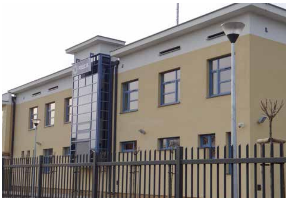
Nowy budynek komisariatu Policji

W pobliżu komisariatu gmina Jabłonna wybudowała parking (16 miejsc dla samochodów – w tym 1 miejsce dla niepełnosprawnych) wraz z chodnikiem (od strony Osiedla Złotej Renety) – jest to element projektu „Rewitalizacja centrum Jabłonce podnosząca, jakość usług kulturalnych, sportowych i turystycznych oraz promocja Gminy Jabłonna i obszaru LGR ZZ” w ramach programu operacyjnego „Zrównoważony rozwój sektora rybołówstwa i nadbrzeżnych obszarów rybackich 2007-2013”. Inwestycja została dofinansowana ze środków unijnych w 85% (ponad 92 tys. zł).