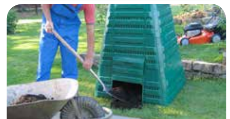
Kompostownik to idealny sposób na stworzenie naturalnego nawozu