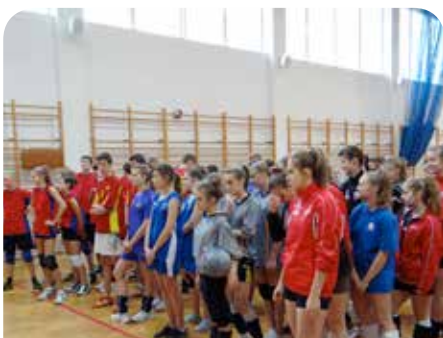
Uczestnicy Mikołajkowego Turnieju o Puchar Wójta Gminy Jabłonna

Chłopcy z Publicznego Gimnazjum im. Orła Białego zajęli I miejsce w VI Mikołajkowym Turnieju Piłki Siatkowej o Puchar Wójta Gminy Jabłonna. W imprezie sportowej, zorganizowanej przez jabłonowskie gimnazjum, wzięło udział osiem zespołów siatkarskich z powiatu legionowskiego.