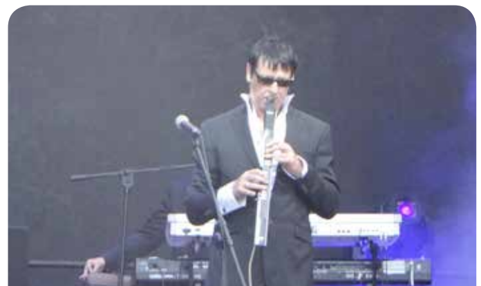
Wystąpił Maciej Maleńczuk