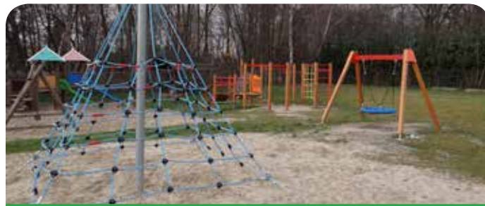
Plac zabaw w Dąbrowie Chotomowskiej ma nowe zabawki

Plac zabaw w Dąbrowie Chotomowskiej – inwestycja polegała na uzupełnieniu oraz urządzeniu placu zabaw. Przygotowano bezpieczną nawierzchnię oraz zamontowano następujące zabawki: zestaw piramida, zestaw małpi gaj, zestaw wspinaczka oraz huśtawkę bocianie gniazdo.