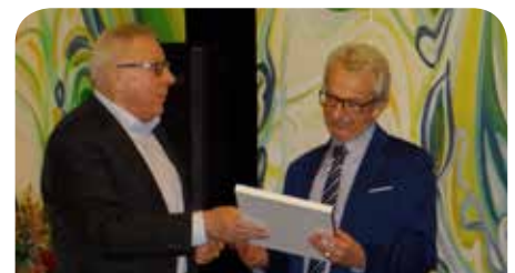
Prof. Lew-Starowicz dostał pamiątkowy album o Jabłonie

Wykład Profesora miał charakter otwarty, każdy, kto chciał zadać pytanie, mógł to zrobić w dowolnym momencie. Podczas spotkania padały pytania dotyczące nie tylko pedofilii, ale również między innymi: seksualności w rodzinie, czy gender study.