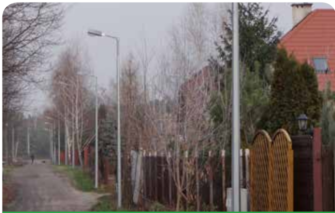
Latarnie oświetliły ul. Spacerową w Chotomowie

Budowa oświetlenia ul. Klonowej w Bożej Woli – w ramach zadania wybudowano oświetlenie – 5 lamp z przezroczystym kloszem stanęło na stalowych ocynkowanych słupach.