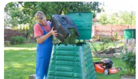
450 kompostowników czeka na odbiór w Urzędzie Gminy

Mieszkańcy, którzy chcą umieścić na swoich posesjach kompostowniki, powinni telefonicznie skontaktować się z Wydziałem Ochrony Środowiska (22 76 77 339) albo z Referatem Gospodarowania Odpadami (22 76 77 347) – o tym czy kompostownik trafi na Państwa podwórko zdecyduje kolejność zgłoszeń.