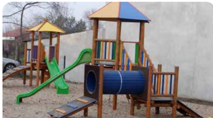
Plac zabaw w Jabłonie

Plac zabaw w Jabłonie przy ul. Parkowej – plac zabaw wyposażono w ramach zadania „Remont i doposażenie placu zabaw przy ul. Parkowej w Jabłonie” realizowanego przy udziale środków z Funduszu Sołectkiego wsi Jabłonna w 2013 r. Plac zabaw wzbogacił się o nowy sprzęt: huśtawkę „ważka” z okrągłego drewna, bujak na sprężynie „Motor”, dwie karuzele oraz „mały domek”. Na placu zabaw dzieci mogą się bezpiecznie bawić dzięki nawierzchni amortyzującej opadki wykonanej z piasku (powierzchnia 120 m 2 ). Teren jest ogrodzony i odpowiednio oznakowany.