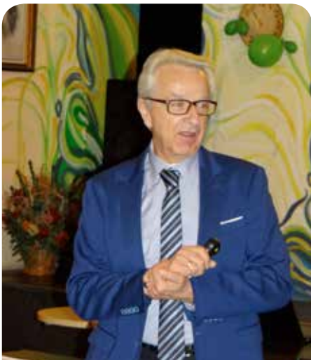
Zbigniew Lew-Starowicz jest cenionym specjalistą w dziedzinie seksuologii

Gościem grudniowego spotkania Zespołu Interdyscyplinarnego był ceniony lekarz psychiatra i psychoterapeuta, ekspert z zakresu seksuologii i konsultant krajowy w tej dziedzinie, biegły sądowy – prof. Zbigniew Lew-Starowicz.