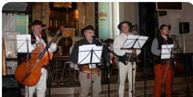
Występ zespołu ONDRASZKI w kościele parafialnym w Jabłonie

Szkoły podstawowe i gimnazjum również uczciły święto Niepodległości podczas okolicznościowych akademii. Ponadto, uczniowie ze Szkoły Podstawowej im. Armii Krajowej w Jabłonie, 22 listopada, zaprezentowali występ patriotyczny pt: „Pamiętam ten dzień” dla seniorów z Domu Kombatanta w Legionowie.