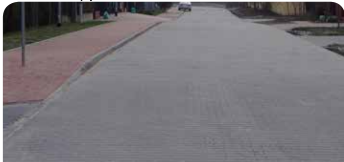
Nowa nawierzchnia ul. Promiennej w Chotomowie

Wykonanie dokumentacji i przebudowa ul. Leśnej w Jabłonie (na odcinku od ul. Przylesie do ul. Słoneczna Polna) - w ramach zadania wykonano dokumentację projektową remontu nawierzchni oraz remont jezdni asfaltowej poprzez sfrezowanie starej nawierzchni i wykonanie nowej pogrubionej – bitumicznej, wykonano też regulację poboczy oraz nowe oznakowanie. Zawarto również umowę na wykonanie dokumentacji budowy chodnika w ul. Leśnej w Jabłonie.