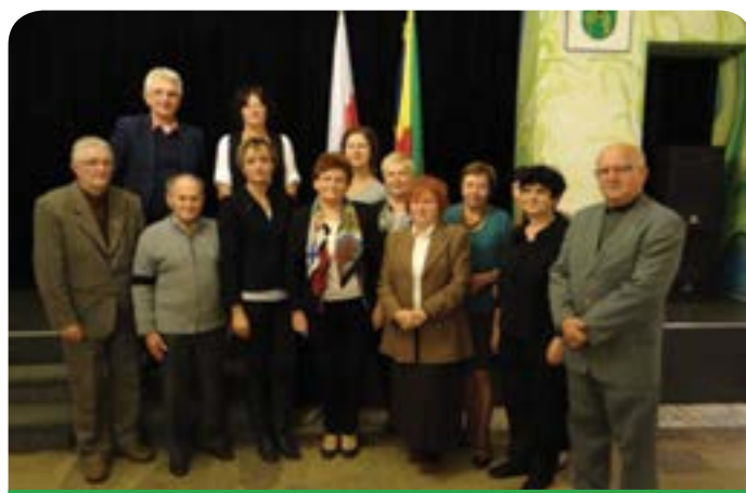
Pierwsze spotkanie Gminnej Rady Seniorów

Podczas pierwszego, organizacyjnego spotkania, członkowie Rady Seniorów dyskutowali na temat problemów, jakie napotykają w służbie zdrowia, o planach na najbliższą kadencję oraz o swojej dotychczasowej działalności.