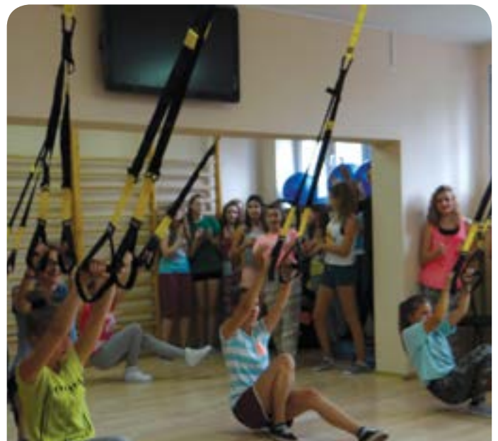
Ćwiczenia z wykorzystaniem taśm TRX wzmacniają mięśnie całego ciała

Nowe wyposażenie sali już cieszy się dużym zainteresowaniem uczniów i z pewnością uatrakcyjni lekcje wychowania fizycznego oraz zajęcia pozalekcyjne.