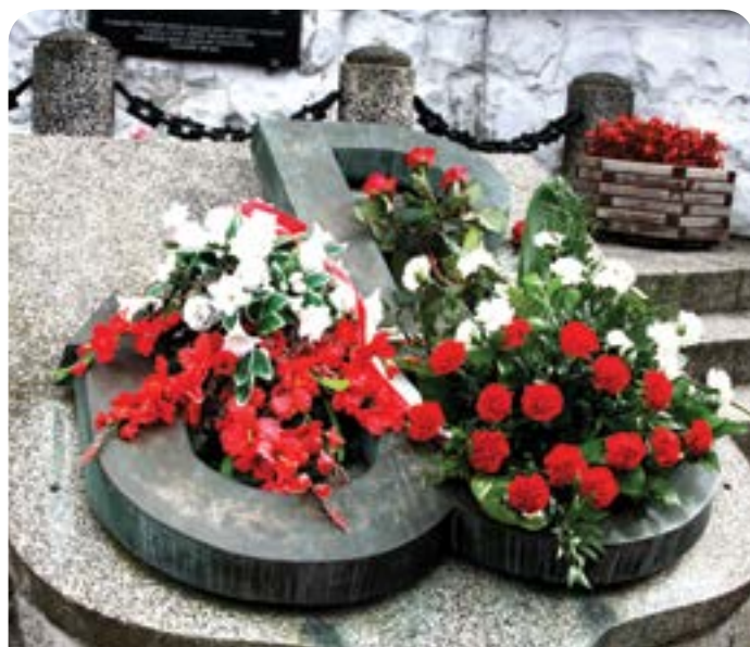
Kwiaty pod pomnikiem Orła Białego