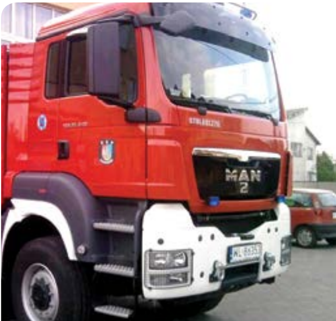
Samochód Ochotniczej Straży Pożarnej w Chotomowie

Państwowa Straż Pożarna w Legionowie otrzymała dofinansowanie z budżetu gminy wysokości blisko 25 tys. zł na zakup średniego samochodu gaśniczego z modułem do ratownictwa technicznego.