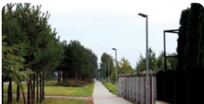
I etap oświetlania chodnika wzdłuż drogi wojewódzkiej 630

Budowa oświetlenia chodnika przy drodze 630- etap I – wykonano oświetlenie chodnika w Suchocinie i w Skierdach na dwóch odcinkach od granicy z Suchocinem do ul. Krótkiej i od nieruchomości na wysokości ul. Orlej do domu weselnego. Łącznie wybudowano 106 szt. lamp oświetleniowych na długości ok. 2625 m za kwotę 247 752,83 zł.