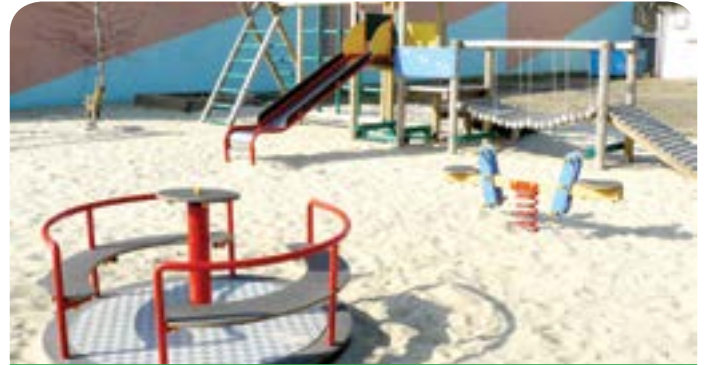
Plac zabaw w Bożej Woli

Dofinansowanie budowy ciągu pieszo-rowerowego wraz z infrastrukturą towarzyszącą w pasie drogi powiatowej 1820W (ul. Partyzantów w Chotomowie i ul. Chotomowska w Jabłonie) – 1600 m ciągu pieszo-rowerowego o szerokości do 2,5 m z kostki betonowej oraz 50 słupów oświetleniowych – inwestycja realizowana wspólnie z Powiatem za kwotę 428 412,66 zł .