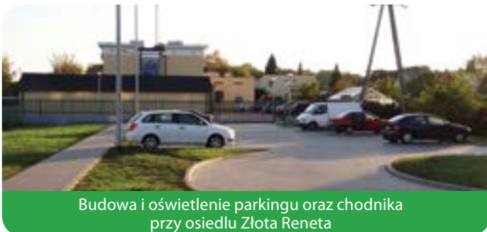
Budowa i oświetlenie parkingu oraz chodnika przy osiedlu Złota Reneta

Wykonanie projektu budowlano-wykonawczego oraz budowa przepompowni ścieków i przewodu tłoczego odprowadzają-