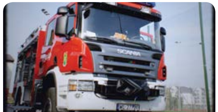
Wóz strażacki zakupiony dla OSP w Jabłonie

Dofinansowanie z programu „OSP-2011” – 80 tys. zł, dofinansowanie z WFOŚiGW ponad 180 tys. zł.