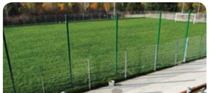
Boisko trawiaste przy nowej szkole podstawowej

Budowa boiska do piłki nożnej w Chotomowie - ramach inwestycji powstało boisko z trawy naturalnej o całkowitej powierzchni 2376 m 2 . Poza płytą boiska, zainstalowane są zraszacze sektorowe (w sumie 6 sztuk), czujnik deszczu powodujący automatyczne wyłączenie instalacji w przypadku wystąpienia naturalnych opadów, 180 metrów sieci wodociągowej, 4 maszty oświetleniowe z oświetleniem ledowym, ogrodzenie, dwie bramki, 4 kosze betonowe i 13 ławek. W ramach gwarancji wykonawca przez pierwszych 12 miesięcy będzie wykonywał zabiegi pielęgnacyjne murawy boiska. Koszt inwestycji: 497 445,64 zł Kwota dofinansowania ze środków zewnętrznych – 310 tys. zł