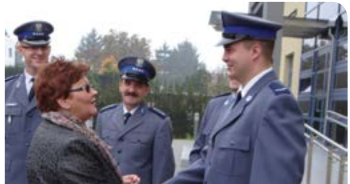
Wójt Gminy przekazała kluczyki Policjantom z Jabłonną