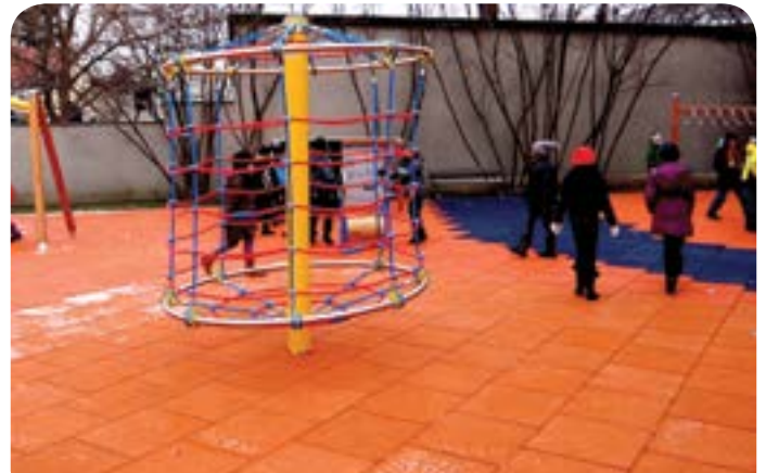
Plac zabaw przy dawnej Szkole Podstawowej w Chotomowie

Kwota dofinansowania ze środków zewnętrznych – ponad 100 tys. zł w ramach programu Radosna Szkoła.