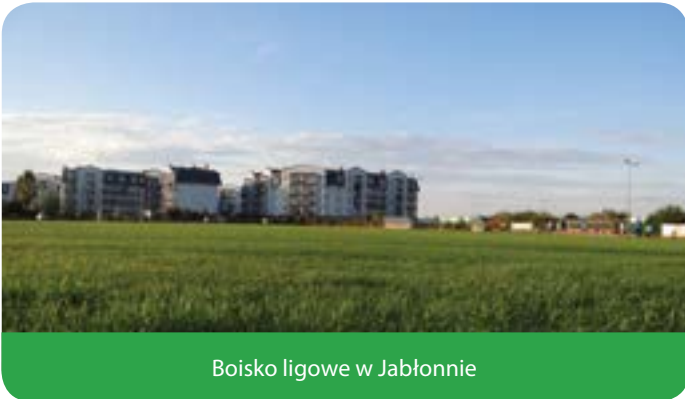
Boisko ligowe w Jabłonie

Przebudowa pełnowymiarowego boiska do piłki nożnej przy Gminnym Centrum Kultury i Sportu - etap I – wybudowano boisko do piłki nożnej z murawą o nawierzchni z trawy naturalnej. Powierzchnia całkowita boiska to 7 370,00 m 2 . Wymiary płyty boiska to 65 na 105 m, co za tym idzie spełnia wymogi PZPN dotyczące możliwości organizowania rozgrywek ligowych.