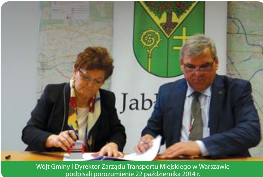
Wójt Gminy i Dyrektor Zarządu Transportu Miejskiego w Warszawie podpisali porozumienie 22 października 2014 r.