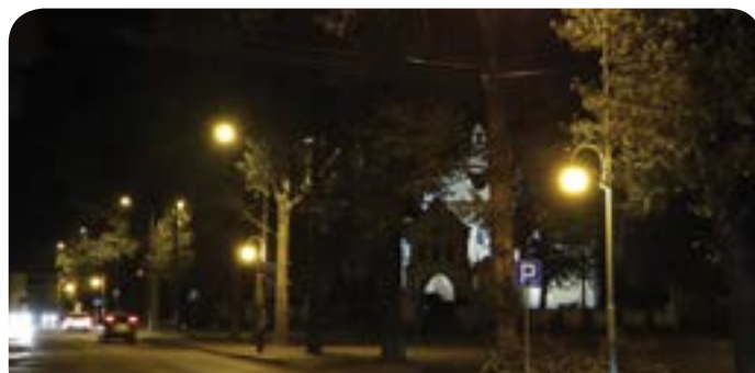
Oświetlenie ul. Partyzantów w Chotomowie

Budowa oświetlenia ul. Żeligowskiego w Chotomowie – wykonano oświetlenie uliczne - 5 sztuk opraw oświetleniowych sodowych montowanych na słupach stalowych wysokości 6 m – za kwotę 16 712,81 zł.