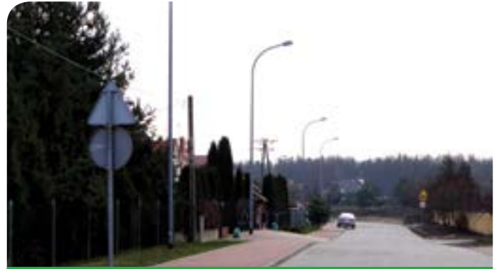
Nowa ul. Promienna w Chotomowie

Budowa chodnika, parkingu i oświetlenia przy ul. Złotej Renety w Jabłonie – w ramach zadania wykonano parking dla samochodów osobowych o nawierzchni z kostki betonowej – w tym: 16 miejsc parkingowych, jedno miejsce dla osób niepełnosprawnych, jezdnię manewrową o szer. 5m, chodnik dla pieszych szer. 2m i 1,5 m o nawierzchni z kostki betonowej. Wykonano również oświetlenie parkingu i chodnika przy parkingu w postaci 5 opraw oświetleniowych.