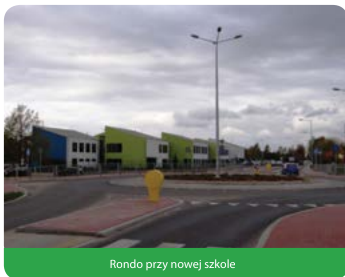
Rondo przy nowej szkole

nej – 14 m). W ramach przebudowy skrzyżowania została zbudowana jezdnia, której szerokość to 6 m. Projekt objął wykonanie – na dojazdach do skrzyżowania – azyli dla pieszych (szer. 2,5 m), natomiast wokół ronda powstały ciągi pieszo-rowerowe o szerokości 2,5 – 3,5 m. Inwestycja objęła budowę odwodnienia skrzyżowania, dwóch zatok autobusowych, zjazdów do przyległych nieruchomości, oświetlenia drogowego oraz oznakowania skrzyżowania. W ramach inwestycji został również zbudowany chodnik wzdłuż ul. Chotomowskiej na odcinku od cmentarza w Jabłonie do nowego ronda.