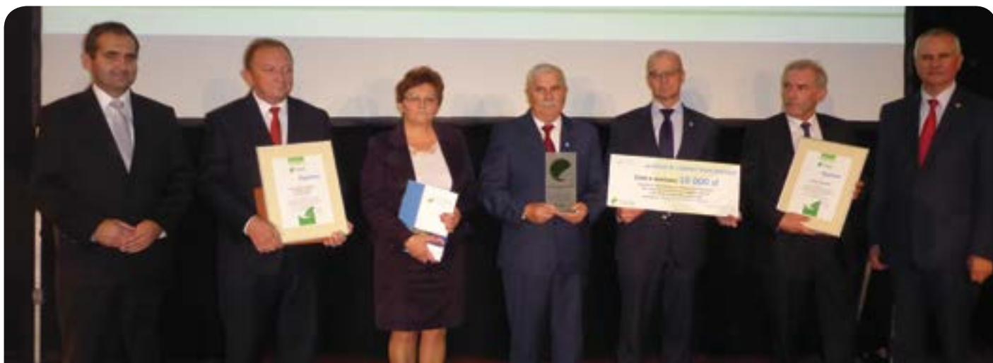
Najlepsi samorządowcy nominowani w kategorii odnawialne źródła energii

Funduszu Ochrony Środowiska i Gospodarki Wodnej w Warszawie na dofinansowanie wykonania projektu kanalizacji w gminie. Na realizację projektu „Budowa systemu gospodarki ściekowej na terenie gminy Jabłonna – etap I opracowanie dokumentacji technicznej”, którego całkowita wartość wynosi 200 tysięcy zł gmina Jabłonna uzyskała dofinansowanie ze środków UE w wysokości ponad 135 tysięcy zł. Pieniądze zostały przyznane gminie w ramach działania „Gospodarka wodno-ściekowa w aglomeracjach powyżej 15 tys. równoważnej liczby mieszkańców” Programu Operacyjnego Infrastruktura i Środowisko 2007-2013.