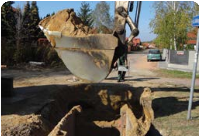
Budowa kanalizacji w ul. Przylesie w Jabłonie

Wykonanie dokumentacji projektowej sieci kanalizacji sanitarnej dla pln. strony ul. Modlińskiej w Jabłonie, na odcinku od posesji nr 236 w kierunku ul. Zegrzyńskiej, wraz z przyłączami i odgałęzieniami do granic przyległych nieruchomości. Koszt wykonania dokumentacji: 36 777 zł.