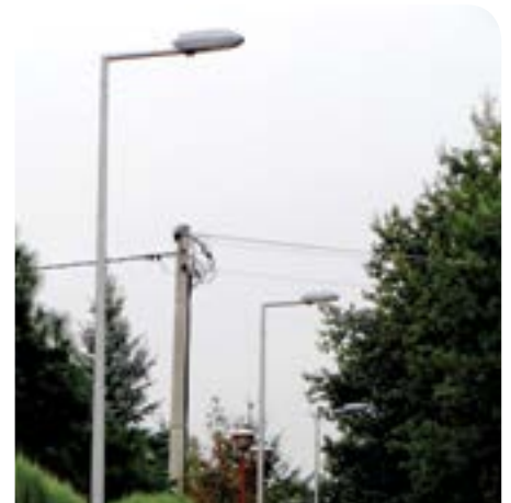
Nowe oświetlenie zostanie zbudowane na trzech odcinkach o łącznej długości 1165 metrów.

Inwestycja gminna będzie polegała na wykonaniu prac ziemnych, montażu i postawieniu słupów stalowych, montażu opraw oświetleniowych 100W. Termin składania ofert, spośród których zostanie wyłoniony wykonawca inwestycji upływa 4 listopada 2014 r. o godz. 10.00.