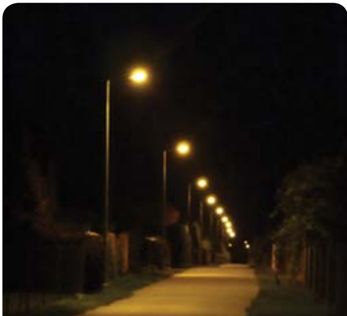
Oświetlona ul. Modrzewiowa w Dąbrowie Chotomowskiej