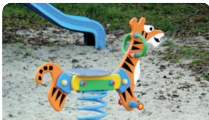
Jedna z zabawek znajdujących się na placu zabaw w Dąbrowie Chotomowskiej

Urządzenie placu zabaw we wsi Janówek Drugi – zamontowano drewniane certyfikowane urządzenia zabawowe: plac zabaw „Jedna Wieża” (bez huśtawki), Ważka, bujak na sprzężynie (kogut), karuzelę, ławkę „piknik”, podwójną huśtawkę. Na placu zabaw wokół zabawek wykonano nawierzchnię z piasku amortyzującą upadki. Wykonano ogrodzenie z furtką i bramą wjazdową. Koszt inwestycji – 23 666,34 zł.