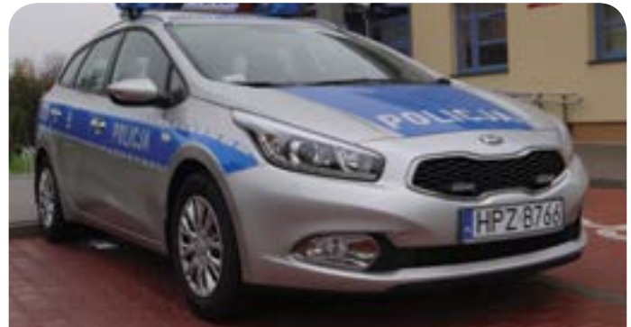
Gmina Jabłonna dofinansowała kupno nowego radiowozu

Nowa Kia ceed jest piątym samochodem funkcjonariuszy Komisariatu Policji w Jabłonce.