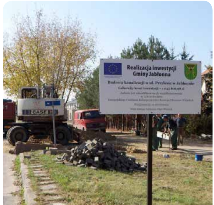
Budowa kanalizacji w ulicy Przylesie

Na koniec warto wspomnieć, że na półmetku jest również projekt realizowany w partnerstwie z fundacją pt. „Nauka, Staż, Praca”, w ramach którego zatrudnienie na okres 6 miesięcy znalazło prawie 40 mieszkańców i mieszanek naszej gminy. Wynagrodzenie uczestników projektu jest finansowane przez Unię Europejską w ramach Programu Operacyjnego Kapitał Ludzki.