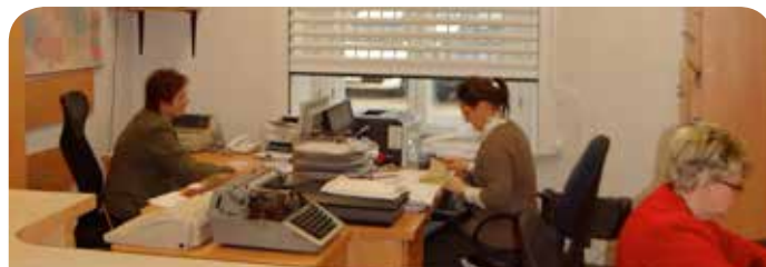
Biuro Spraw Obywatelskich pok. nr 9

Nr tel. do Biura Spraw Obywatelskich - 22 767 73 44