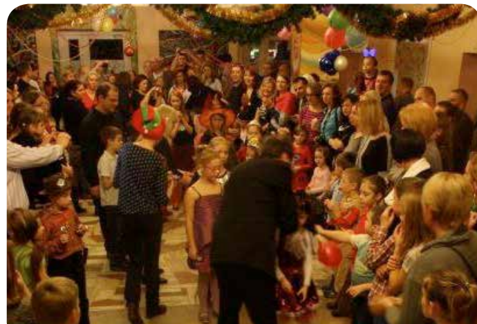
Zabawa w Jabłonce