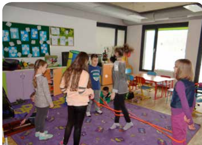
Ferie zimowe w Jabłonie

W GCKiS Skierdy przez cały okres ferii zimowych prowadzona była bezpłatna świetlica dla dzieci.