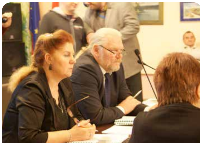
Posiedzenie Rady Gminy Jabłonna