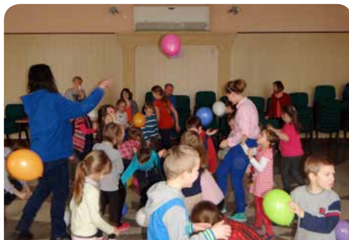
Zabawa w Chotomowie