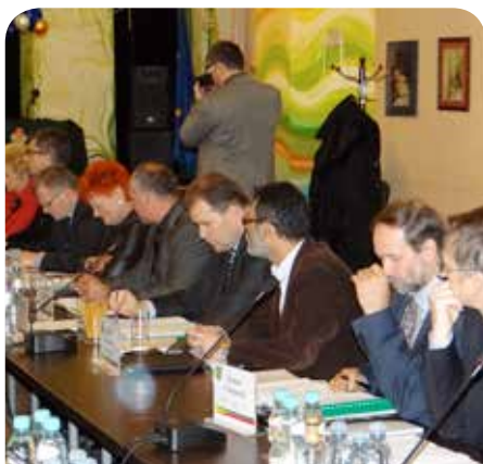
Radni podczas sesji