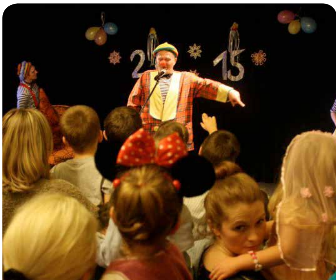
Spotkania były pełne atrakcji

Dzięki zaangażowaniu sołtysów, członków Rad Sołeckich, sponsorów, rodziców oraz radnych, dzieci z naszej gminy mogły bawić się na kilku imprezach choinkowych.