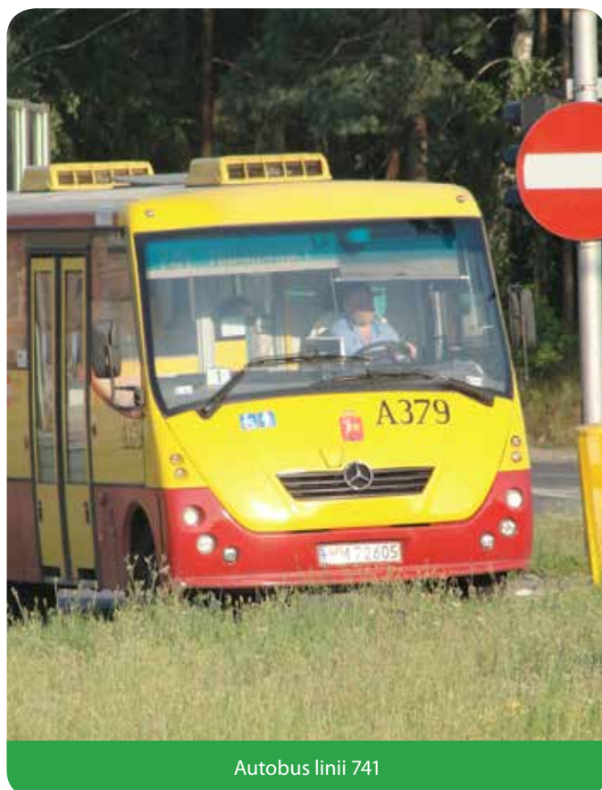
Autobus linii 741

Wyniki ankiety dostępne są na: www.jablonna.pl