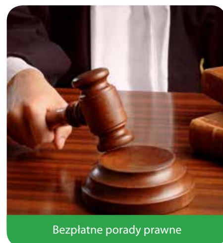
Bezpłatne porady prawne

Regulamin bezpłatnych porad prawnych drogą elektroniczną jest dostępny na: www.jablonna.pl