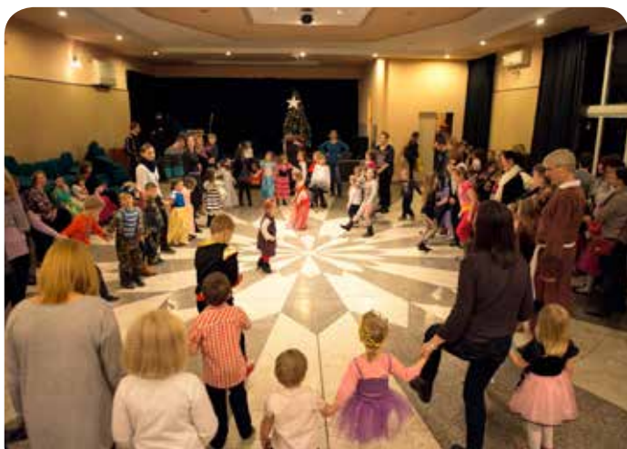
Spotkanie w Chotomowie

Wszystkie zabawy pełne były nie tylko tanecznych rytmów, ale i świątecznych podarunków wprost z mikołajowego worka. Nie zabrakło także występów artystycznych, wspólnego śpiewania oraz konkursów. Na uwagę zasługują też same dzieci, a konkretnie ich kostiumy, dzięki którym każda z imprez była kolorowa i bajeczna.