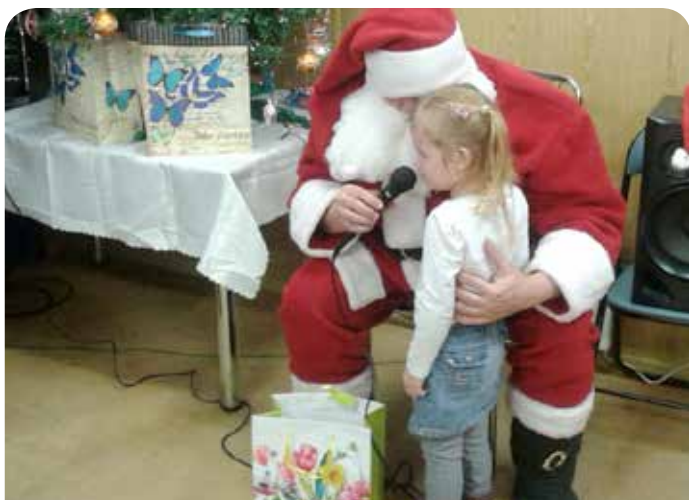
Choinka w Janówku II