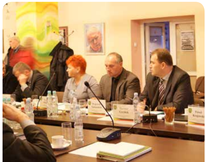
Posiedzenie Rady Gminy Jabłonna