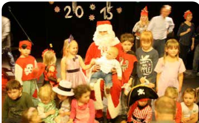
Zabawa choinkowa w Jabłonie

Sołtys wsi Jabłonna składa podziękowanie firmie Dachmur z Jabłony za pomoc w organizacji balu sołecznego.