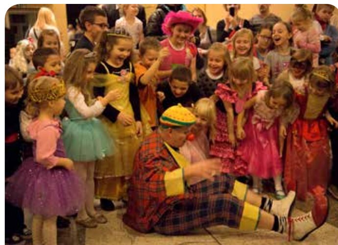
Zabawa w Chotomowie