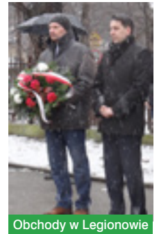
Obchody w Legionowie