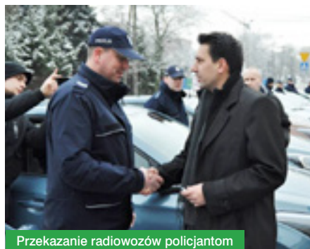
Przekazanie radiowozów policjantom

przekroczył kwotę 250 tys. zł, zaś udział powiatu wyniósł 60 tys. zł. Samochody marki Dacia Duster, Hyundai i20, Opel Corsa oraz Kia Ceed niezwłocznie rozpoczną służbę w poszczególnych komisariatach i wyjadą na powiatowe ulice.