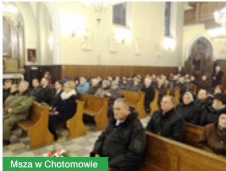
Msza w Chotomowie