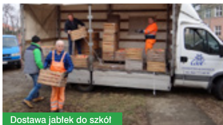
Dostawa jabłek do szkół

Jabłka trafiły do uczniów szkół podstawowych w Jabłonie i Chotomowie, gimnazjum w Chotomowie oraz Domu dziecka w Chotomowie. Druga tura zdrowej przekąski trafiła do naszej gminy 18 lutego. Tym razem do rozdania było 858 skrzynek, czyli około 19 734 kg jabłek. Wszystkie owoce trafiły do uczniów i ich rodzin.