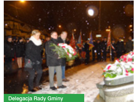
Delegacja Rady Gminy