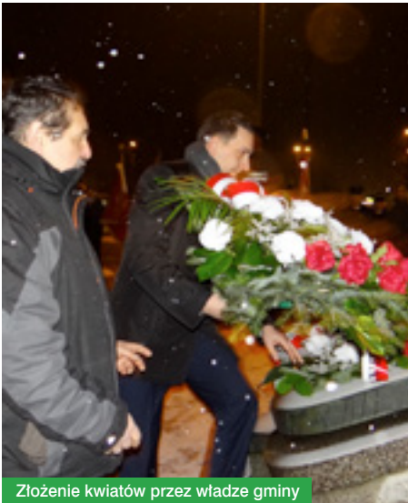
Złożenie kwiatów przez władze gminy

Obchody rozpoczęła Msza święta odprawiona o godzinie 18.00 w kościele parafialnym w Chotomowie. Po nabożeństwie zebrani przeszli pod Pomnik Chwały Bohaterów Walk z hitlerowskim najeźdźcą w Chotomowie (przy rondzie), gdzie delegacje złożyły kwiaty.