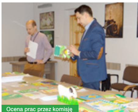
Ocena prac przez komisję

Należy podkreślić, że autorzy wszystkich nadesłanych kartek wykazali się inwencją twórczą i zaangażowaniem za co serdecznie dziękujemy i liczymy, że ponownie oczarują nas swoimi pracami w kolejnych konkursach.