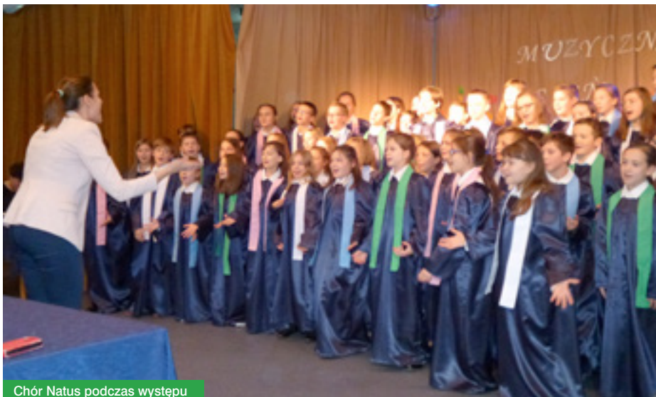
Chór Natus podczas występu

W marcu 2014 roku chór po raz pierwszy reprezentował szkołę na Festiwalu Dziecięcej i Młodzieżowej Twórczości Artystycznej ASTERIADA w Warszawie, gdzie rywalizując z zespołami oraz chórami województwa mazowieckiego nasz chór zdobył wyróżnienie.