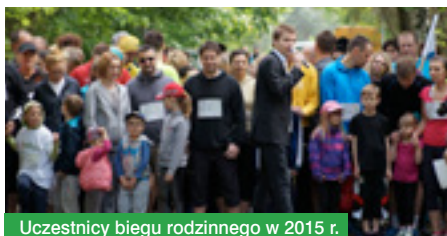
Uczestnicy biegu rodzinnego w 2015 r.

Rozpoczęły się zapisy na trzeci bieg terenowy „Bieg Po Złote Jabłko”. W ramach imprezy zaplanowano bieg na 10, bieg rodzinny i nordic