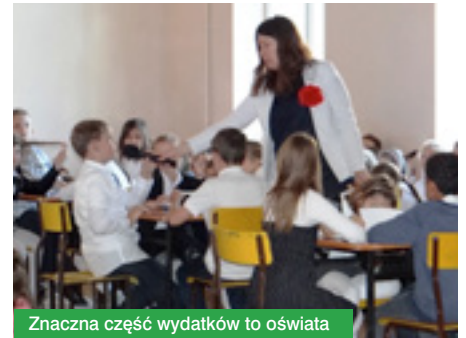
Znaczna część wydatków to oświata

Tegoroczny plan wydatków zakłada przeznaczenie 5 832 252 zł na realizację zadań inwestycyjnych, w tym: – 1,6 mln zł na wykonanie dokumentacji projektowej i budowę sieci wodociągowej oraz wykonanie dokumentacji projektowej sieci kanalizacji sanitarnej i budowę systemu gospodarki ściekowej w gminie Jabłonna; – 1,5 mln na rozbudowę Przedszkola Gminnego w Jabłonie; – 1 225 000 zł na transport i łącznie w tym na: dotację dla powiatu legionowskiego na projekt i budowę chodnika w ciągu drogi powiatowej ul. Klonowej w Bożej Woli (od ul. Modlińskiej do granicy gminy), wykonanie projektu i przebudowę ul. Szkolnej w Jabłonie (przy SP), przebudowę ul. Przylesie (zgodnie z istniejącą dokumentacją), wykonanie łącznika ul. Zegrzyńskiej i Szarych Szeregów, wykonanie projektu i przebudowę skrzyżowania Bagiennej z Partyzantów w Chotomowie; – ponad 316 tys. zł na oświetlenie ulic, placów i dróg; – prawie 57 tys. zł na zagospodarowanie i urządzenie terenu przy kompleksie boisk za Domem Ogrodnika w Jabłonie.