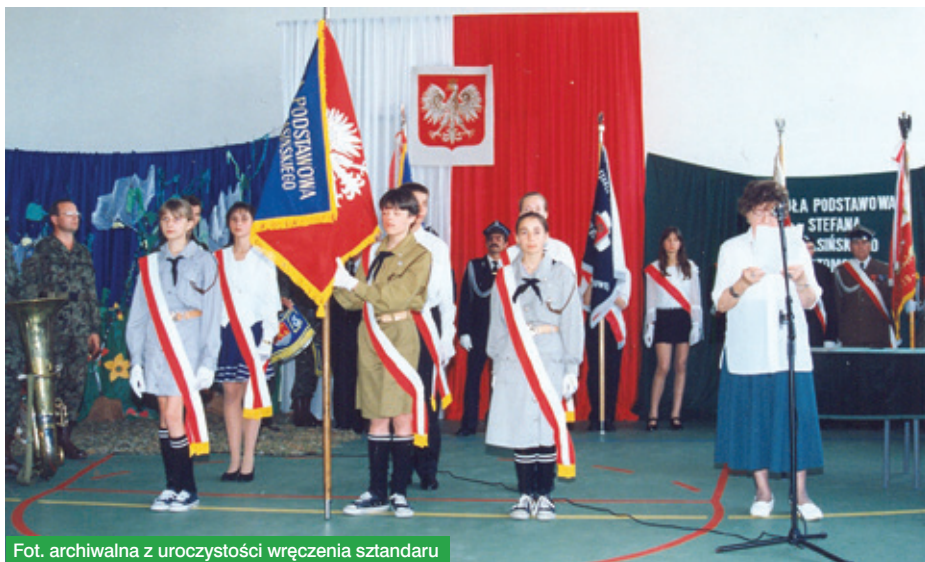
Fot. archiwalna z uroczystości wręczenia sztandaru