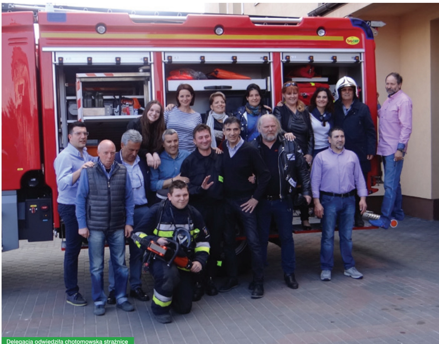
Delegacja odwiedziła chotomowską strażnicę