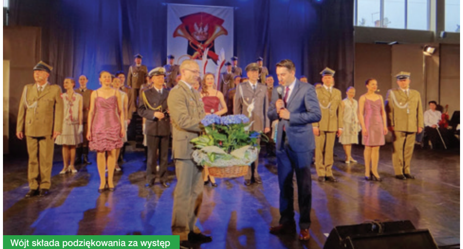
Wójt składa podziękowania za występ

Dziękujemy i zapraszamy na kolejne wydarzenia w gminie Jabłonna!