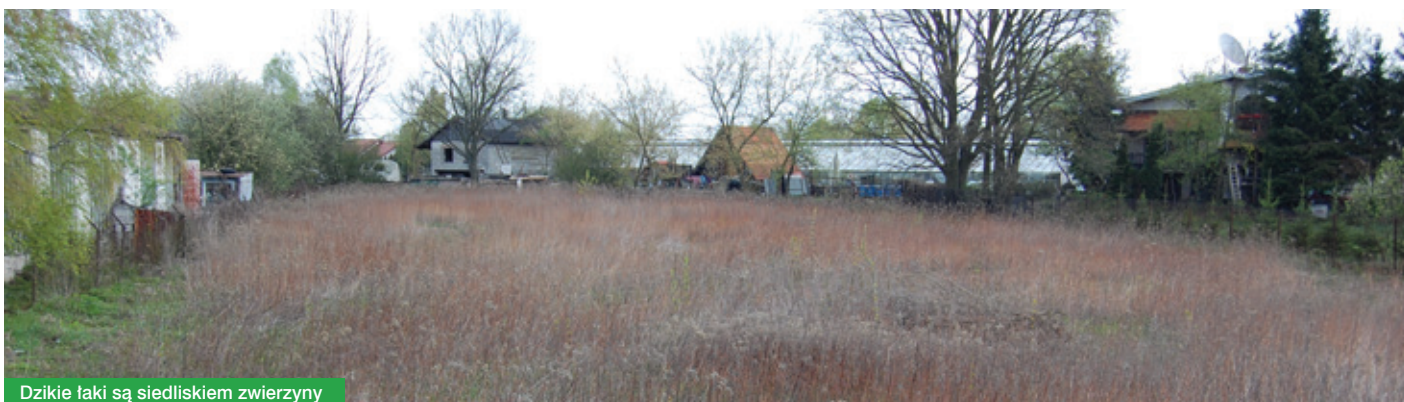
Dziki łąki są siedliskiem zwierzyny

Jednocześnie informuje się, że bez zezwolenia można usunąć drzewa których obwód na wysokości 5 cm nie przekracza: a) 35 cm – w przypadku topoli, wierzb, kasztanowca zwyczajnego, klonu jesionolistnego, klonu srebrzystego, robinii akacjowej oraz platanu klonistego. b) 25 cm – w przypadku pozostałych gatunków drzew. Drzewa owocowe również nie wymagają uzyskania zezwolenia na usunięcie.