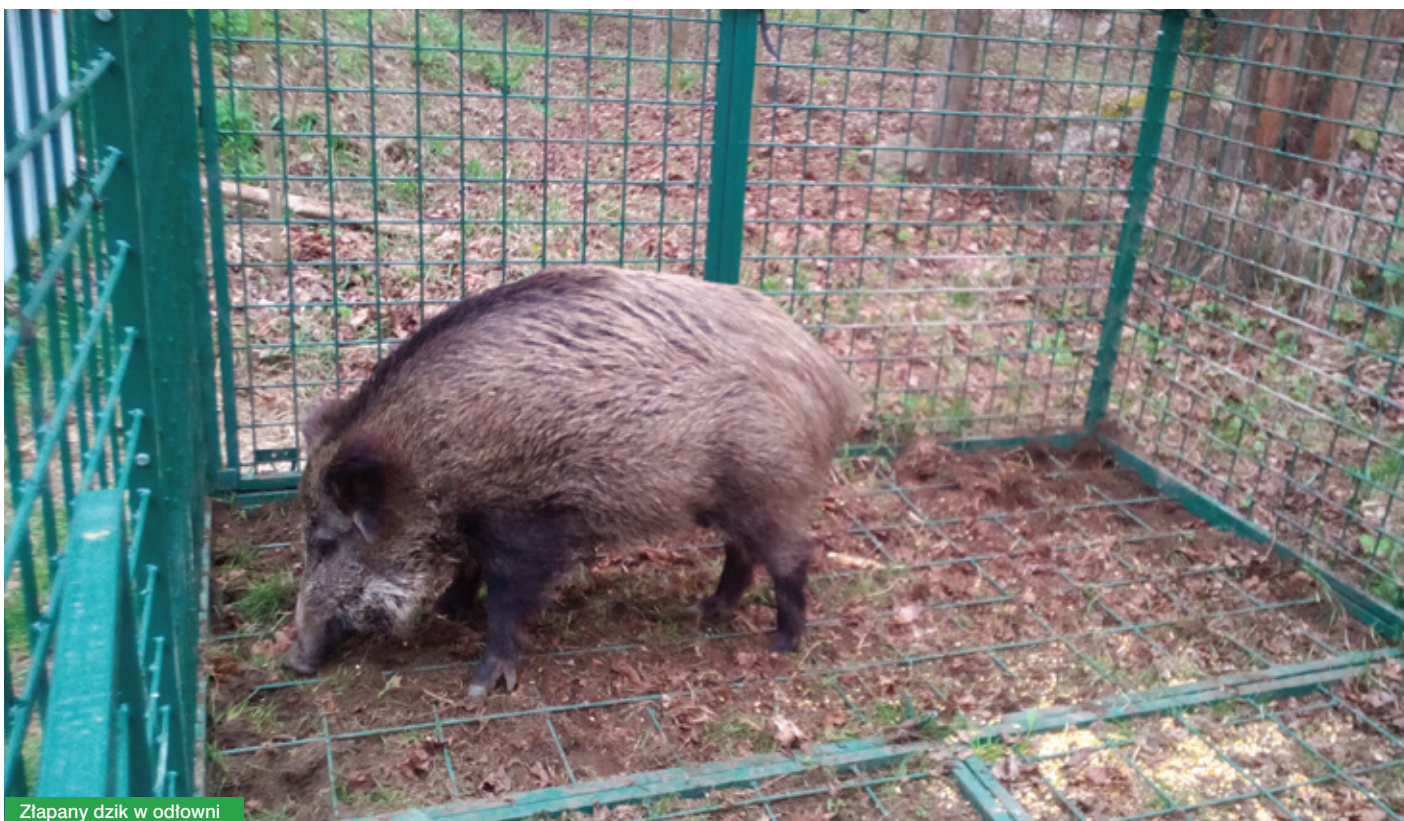
Złapany dzik w odłowni