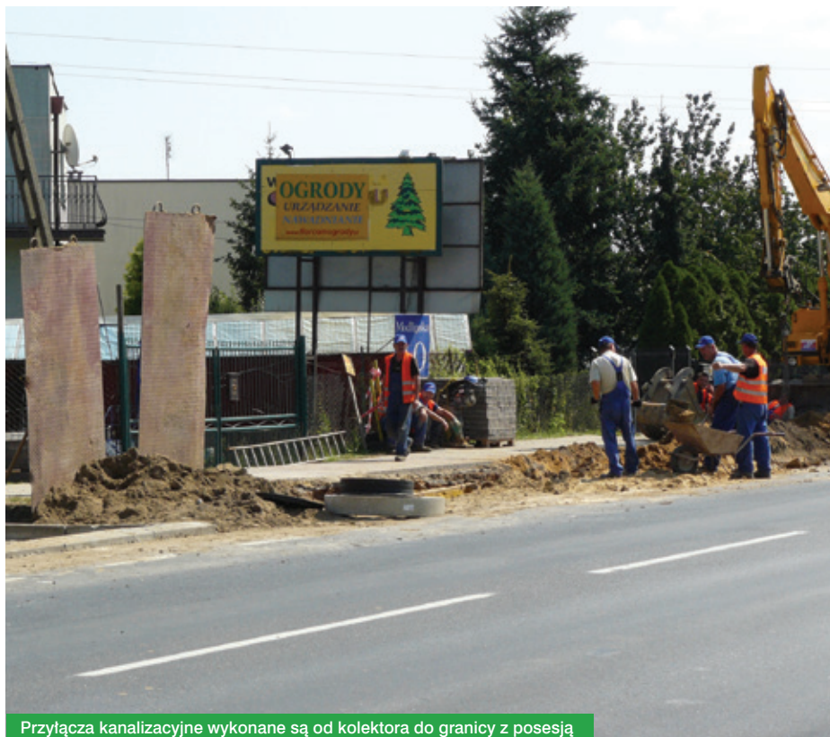
Przyłącza kanalizacyjne wykonane są od kolektora do granicy z posesją

Pomimo posiadania przez Gminę doświadczenia związanego z aplikowaniem, realizacją oraz rozliczaniem projektów unijnych, ilość dokumentów koniecznych do przygotowania oraz złożoność opracowania zwanego studium wykonalności projektu, a stanowiącego nieodłączną część wniosku o dofinansowanie, wymagała zlecenia części zadań firmom zewnętrznym. Tak się właśnie stało w przypadku studium wykonalności oraz analizy koncentracji mieszkańców. Dokumenty te stanowiły obligatoryjny załącznik do wniosku, a ich koszty zostaną częściowo pokryte (w wysokości 63,75%) w ramach dofinansowania.