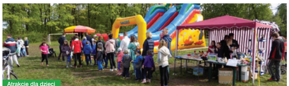
Atrakcje dla dzieci