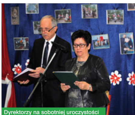
Dyrektorzy na sobotniej uroczystości