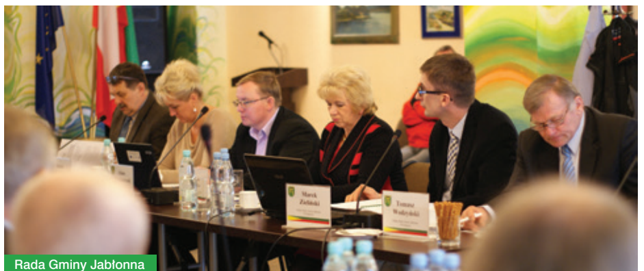
Rada Gminy Jabłonna

Zarządzenie nr 31/2016 Wójta Gminy Jabłonna z dnia 31 marca 2016 r. w sprawie przeprowadzenia konsultacji społecznych projektu uchwały w sprawie uchwalenia Statutu Gminy Jabłonna oraz formularz są dostępne na stronie internetowej gminy Jabłonna.