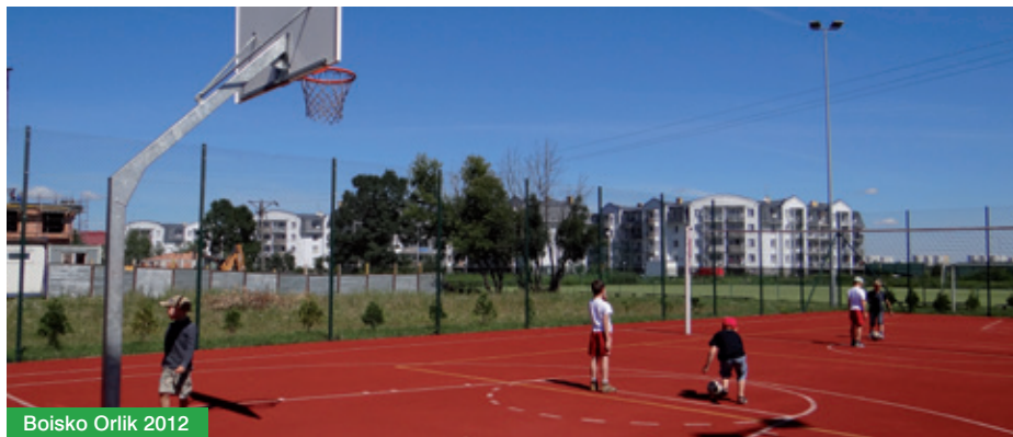
Boisko Orlik 2012

Dyżury animatorów odbywają się na boiskach Domu Ogrodnika w Jabłonie, w gimnazjum w Chotomowie oraz na boisku przy szkole podstawowej w Chotomowie.