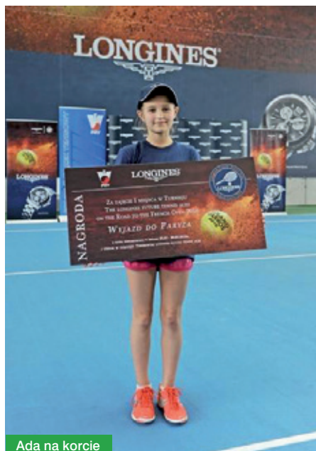
Ada na korcie