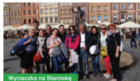
Wycieczka na Starówkę