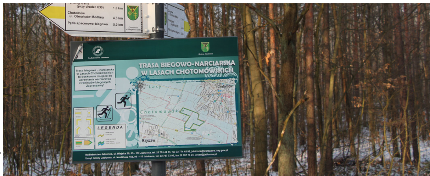
Fot. trasa biegowo-narciarska w Lasach Chotomowskich