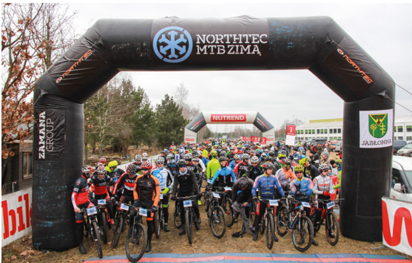
Fot. Uczestnicy na linii startowej wyścigu