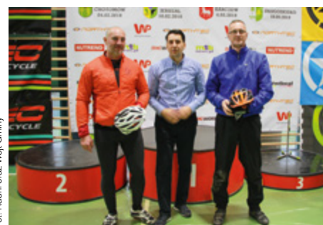
Fot. Radni oraz Wójt Gminy