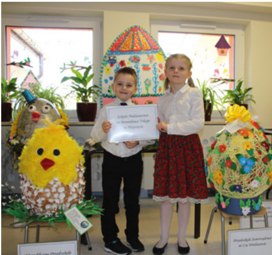
I miejsce w konkursie

Pisanki imponujących rozmiarów przygotowane przez przedszkolaków są przepiękne! Serdecznie gratulujemy wszystkim uczestnikom Konkursu!