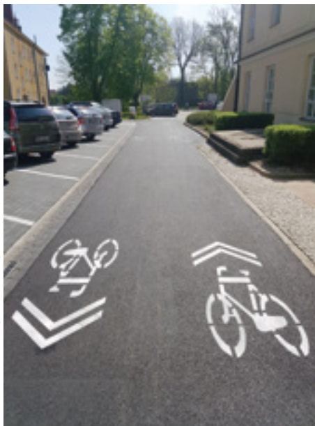
Fot. Ścieżka rowerowa przy Urzędzie Gminy Jabłonna

W ramach prac prowadzonych na odcinku ul. Strużańskiej (DW632) Gmina wybudowała 1,5 km asfaltową ścieżkę rowerową wraz z oświetleniem. Zarówno prace