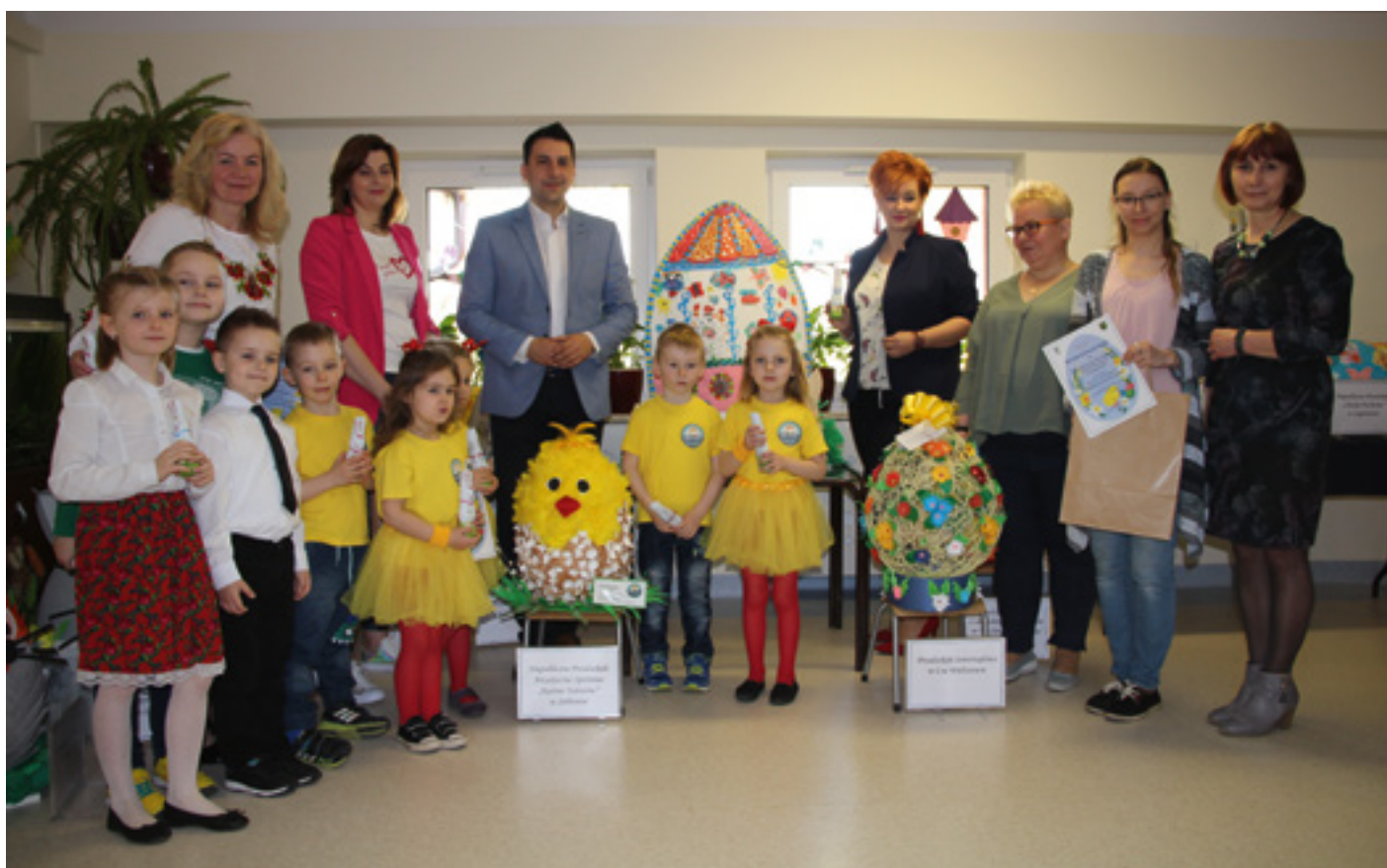
Fot. Uczestnicy konkursu