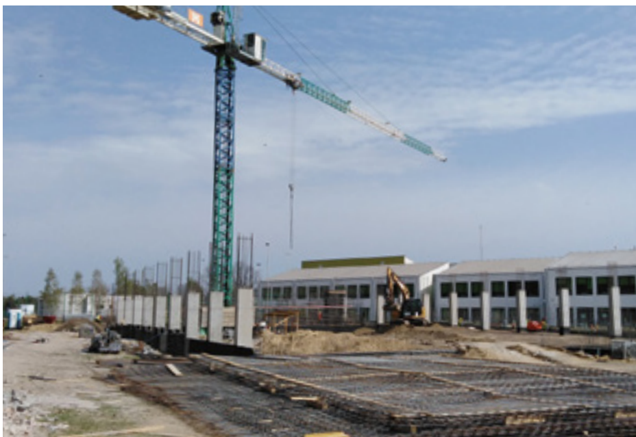
Fot. Budowa sali sportowej

O postępach na budowie będziemy Państwa informować na bieżąco na www.jablonna.pl