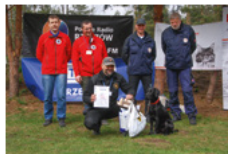
Fot. Zdobywcy II miejsca

Zadra za część węchową uzyskała 100 na 100 punktów. To ogromny sukces, ponieważ tak wysoka punktacja uzyskiwana jest niezwykle rzadko, nawet przez bardzo doświadczone zespoły. Z posłuszeństwa Zadra uzyskała 70 na 100 punktów czyli również bardzo dobry wynik jak na tak młodego psa. Tym samym, zespół Arkadiusz Karwiński i Zadra zdobyli w ogólnej klasyfikacji II miejsce! Pozostałym