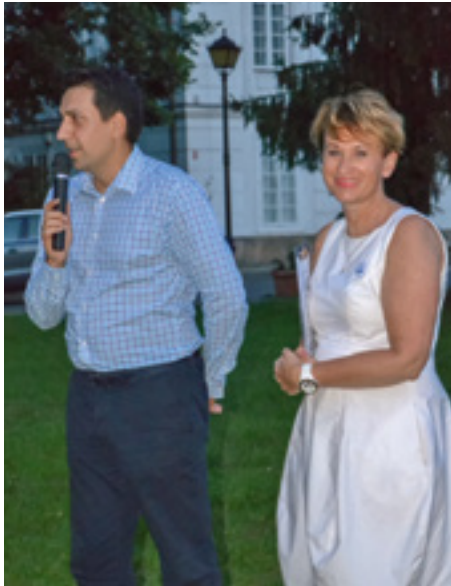
Fot. Wojciech Chodowski oraz dyrektor Katarzyna Mołęda

Rozmowa z dyrektorem Domu Zjazdów i Konferencji w Jabłonie Polskiej Akademii Nauk – Katarzyną Mołędą.