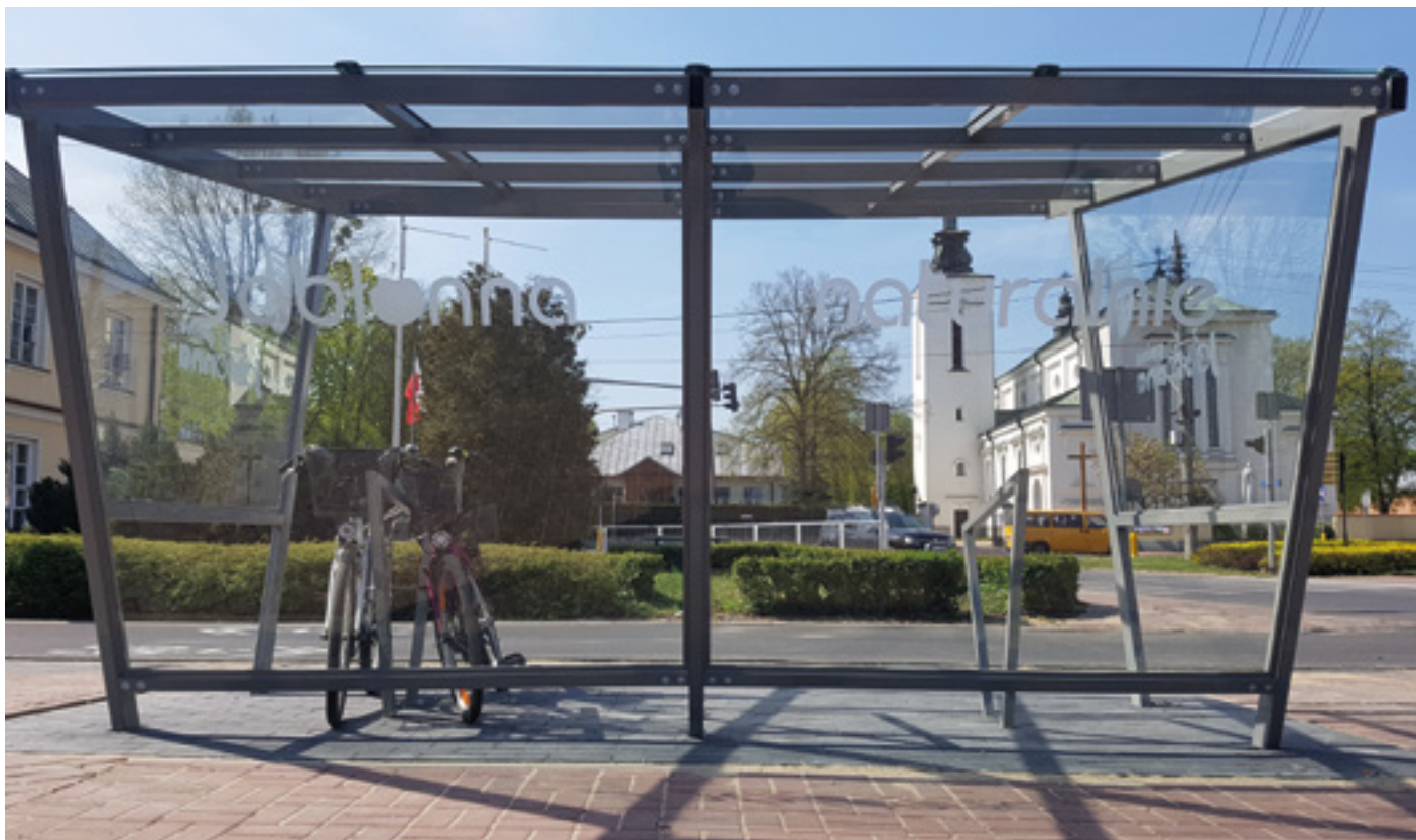
Fot. Włocławek przy Urzędzie Gminy Jabłonna