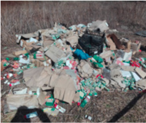
Fot. Dzikie wyspiśko w Jabłonie

Dzięki czujności i sprawnej reakcji pracowników Referatu Ochrony Środowiska i Gospodarki Odpadami oraz jabłonowskiej policji sprawca zaśmiecania został zidentyfikowany.