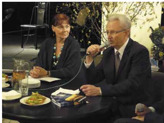
Promocja książki „Narodzenie duszy” odbyła się 12 października

Publikacja i promocja tej książki dzięki uprzejmości władz gminnych, otwiera przede wszystkim dla mnie wielkie wyzwanie do dalszej intensywnej pracy. Na rzecz mieszkańców naszej kochanej społeczności, tu nad Wisłą, gdzie potrze-