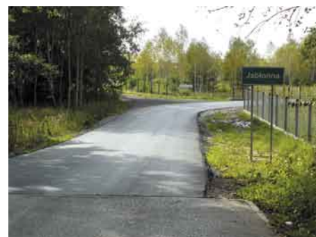
Granica z Legionowem zyskała zupełnie nowy wygląd i jakość

Od 30 września sprawniej można ponadto dojechać także do Chotomowa, od strony Gminy Wieliszew. Tego właśnie dnia oficjalnie oddano do użytku drogę prowadzącą ze Skrzyszewa do Chotomowa, zwaną popularnie „Schemynówką”. Oficjalnego odbioru dokonali