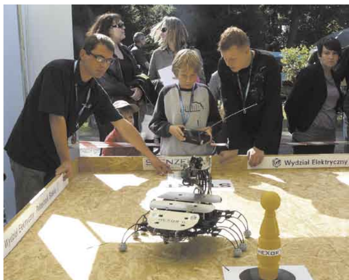
Slalom mini robotem dla wielu był nie lada wyzwaniem

Na najmłodszym najbardziej do gustu przypadły stoiska, gdzie naukę można było połączyć z zabawą. Malowanie inspirowanych krajami arabskimi obrazów, zabawa w alpinistę czy jazda super oszczędnym samochodem aerodynamicznym, to część atrakcji z jakich korzystali młodzi goście festiwalu. Na samej zabawie jednak się nie kończyło. Przy