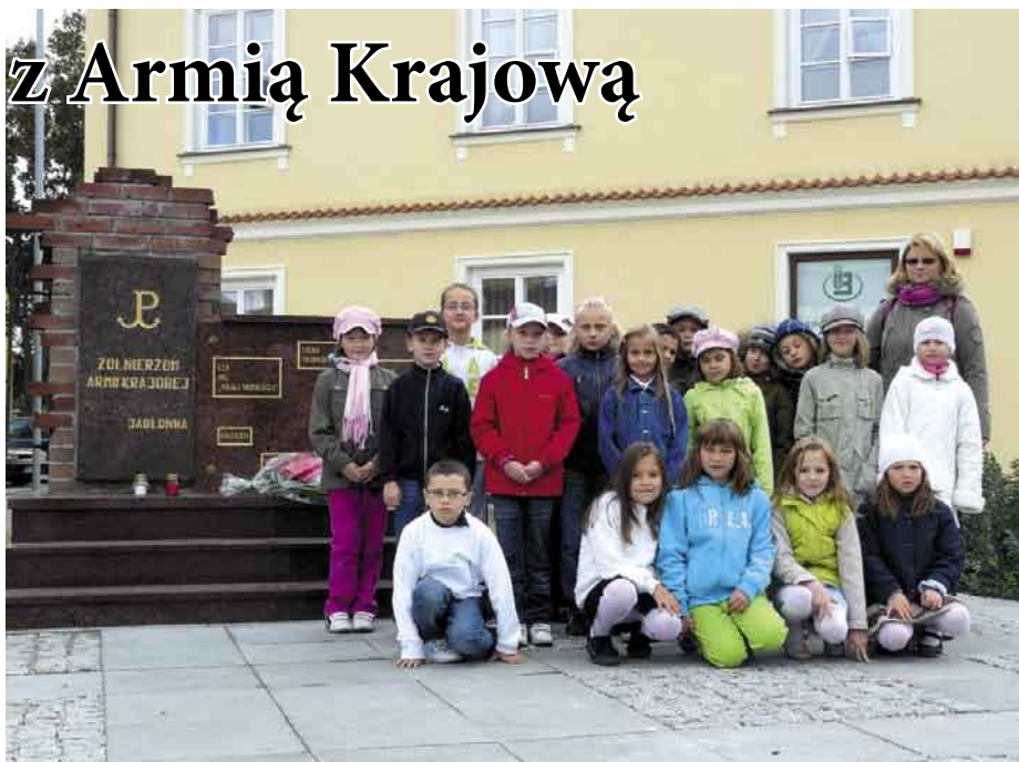
Uczniowie jabłonowskiej szkoły przez cały dzień oddawali cześć swojemu patronowi

Po Mszy, uroczystości przeniosły się do budynku szkoły. Na sali gimnastycz-