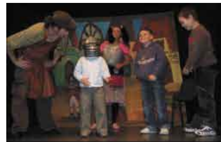
Inaugurację sezonu rozpoczął Bazyliuszek

Na pierwszy spektakl wybrano „Bazyliuszka”. Dwójka krakowskich aktorów z Teatru ART-RE przez prawie godzinę znakomicie bawili publiczność wciągając dzieciaki na scenę do aktywnego uczestnictwa w spektaklu. Okazało się, że wiele dzieci znało prezentowaną bajkę i „podpowiadało” aktorom co mają robić, żeby uchronić się przed wzrokiem Bazyliuszka.