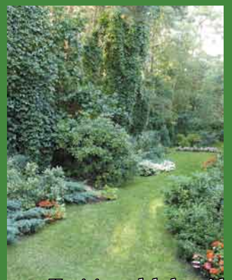
II miejsce zdobył ogród Państwa Gronowskich