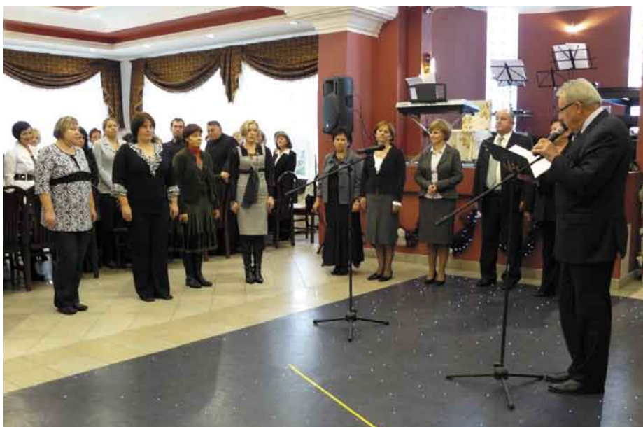
Ceremonia wręczenia aktów mianowania i medali wywołała wiele wzruszeń