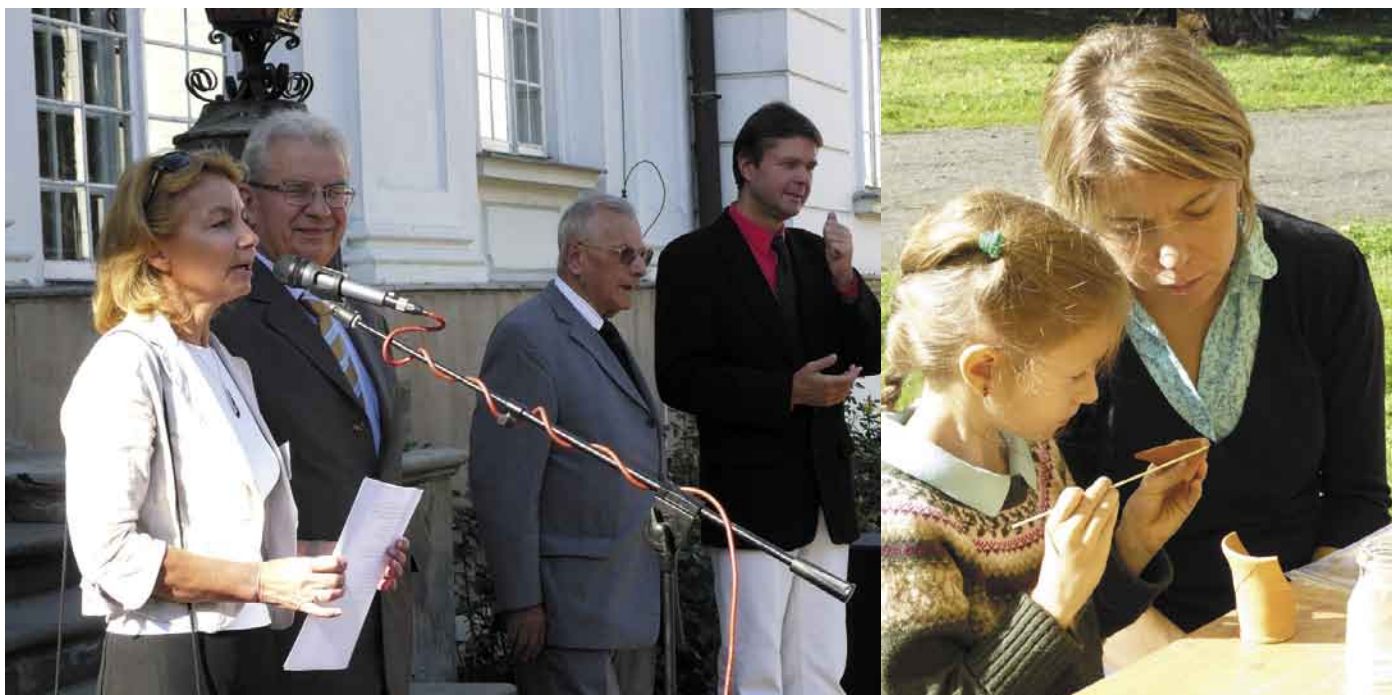
Festiwal zaingurowano w sobotę punktualnie o godzinie 10.00.