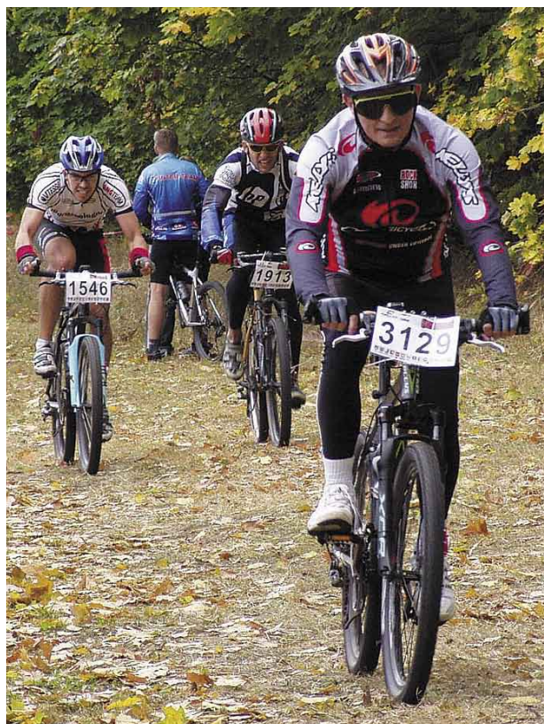
Trasa zawodów biegła przez Jabłonnę i Chotomów