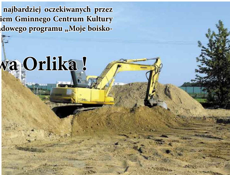
Prace nad budową Orlika trwają nieprzerwanie od kilku tygodni

Obiekty powstaną na tyłach jabłonowskiego Gminnego Centrum Kultury i Sportu, w sąsiedztwie istniejącego już boiska klubu „Wisła Jabłonna”. W miejscu tak zwanych kortów oraz placu manewrowego, wybudowane będzie boisko wielofunkcyjne, a zaraz obok, to do piłki nożnej.