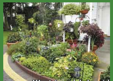
III miejsce zdobył ogród Antoniny Smolińskiej