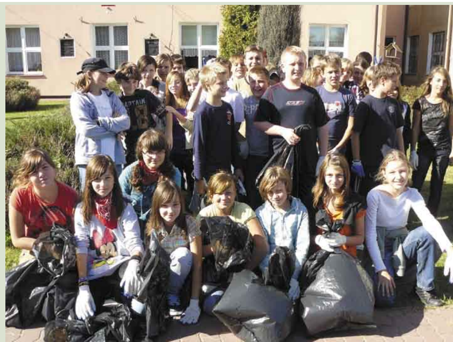
Uczniowie z Chotomowa tuż przed ruszeniem w teren