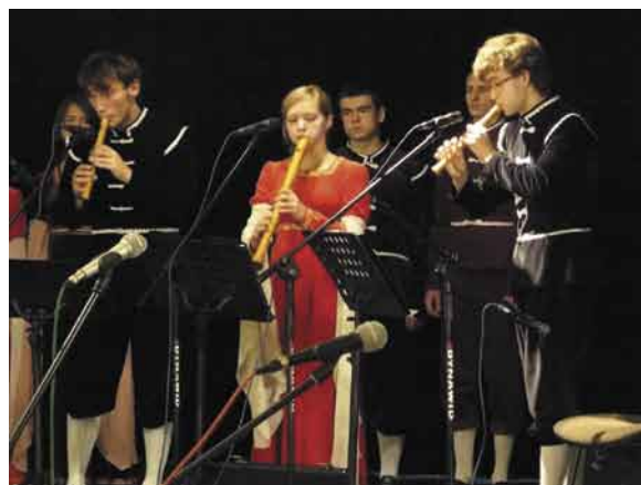
Inaugurację uświetniła grupa Horrendus