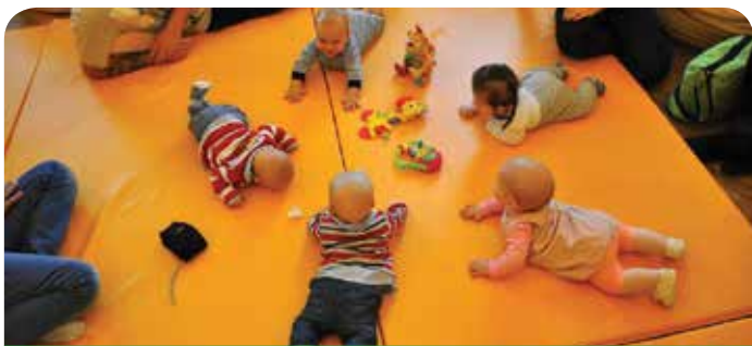
Szkoła Rodzenia jest w 100% finansowana przez gminę

Zajęcia Szkoły Rodzenia odbywają się w soboty od godz. 9.00 do 12.00 w Domu Ogrodnika w sali Lustrzanej. Dotyczą porodu (naturalnego i cięcia cesarskiego), pielęgnacji noworodka (ćwiczenia na lalkach), karmienia piersią, położu, sprawności kobiety w ciąży i po porodzie (ćwiczenia z fizjoterapeutką) oraz udzielanie pierwszej pomocy noworodkom i niemowlętom (ćwiczenia na fantomie). Warto dodać, że zajęcia pierwszej pomocy są w większości szkół rodzenia dodatkowo płatne. W naszej gminie są włączone w program, by całościowo przygotować młodych rodziców do opieki nad dzieckiem.