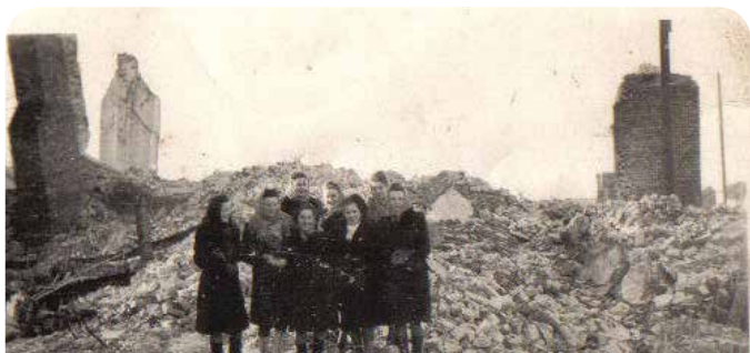
Mieszkaniczki Jabłony przy ruinach kościoła wysadzonego przez Niemców