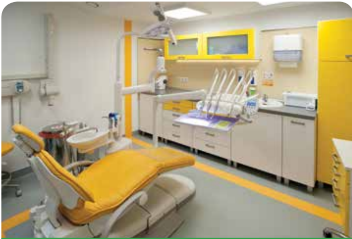
Jeden z gabinetów stomatologicznych w DP Med

Od marca Centrum Medyczne DP Med, realizuje dwie usługi w ramach „Gminnego Programu Profilaktyki i Promocji Zdrowia” na rok 2015 uchwalonego przez Radę Gminy Jabłonna 29 grudnia 2014 roku.