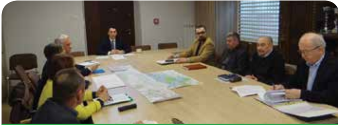
Spotkanie w sprawie modernizacji wałów

16 kwietnia odbył się przegląd wałów na odcinku od Jabłonna do Nowego Dworu Mazowieckiego.