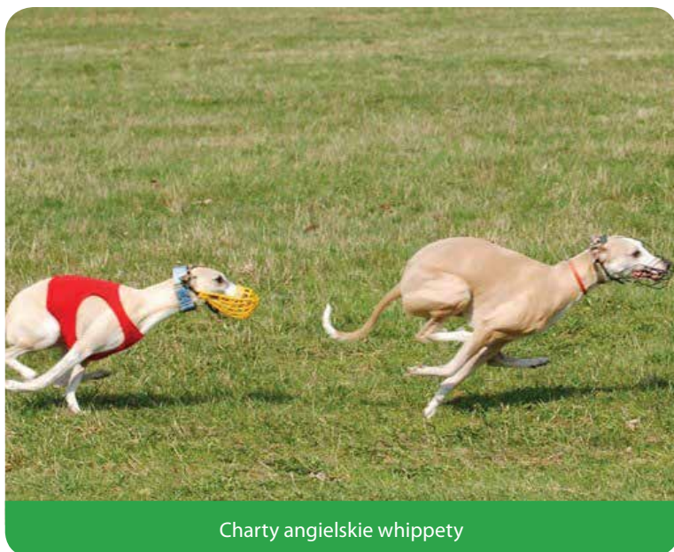
Charty angielskie whippet

Ponad 50 km na godzinę w centrum miasta? Bez mandatu? Charty w Jabłonce będą mogły bezkarnie przekraczać dozwoloną prędkość.