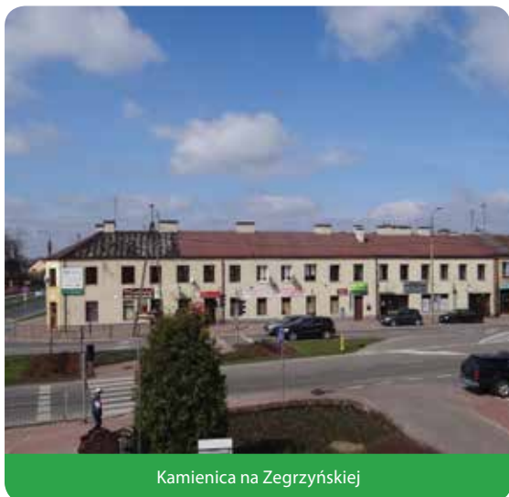
Kamienica na Zegrzyńskiej

2 kwietnia odbyła się Nadzwyczajna Sesja Rady Gminy Jabłonna. Główny punkt stanowiło głosowanie nad uchwałą wyrażającą zgodę na kupno kamienicy przy ulicy Zegrzyńskiej.