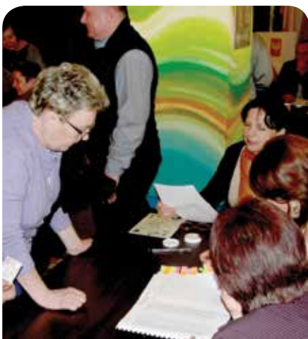
Wybory sołectkie w Jabłonie