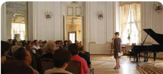
Koncert z cyklu Pałacowe spotkania z muzyką

Dyrektor Domu Zjazdów i Konferencji PAN w Jabłonie. Rozmawiał Michał Smoliński.